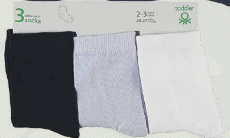
Носки, 699 руб., 349 руб. , Benetton, 2 этаж Центра Галереи Чижова