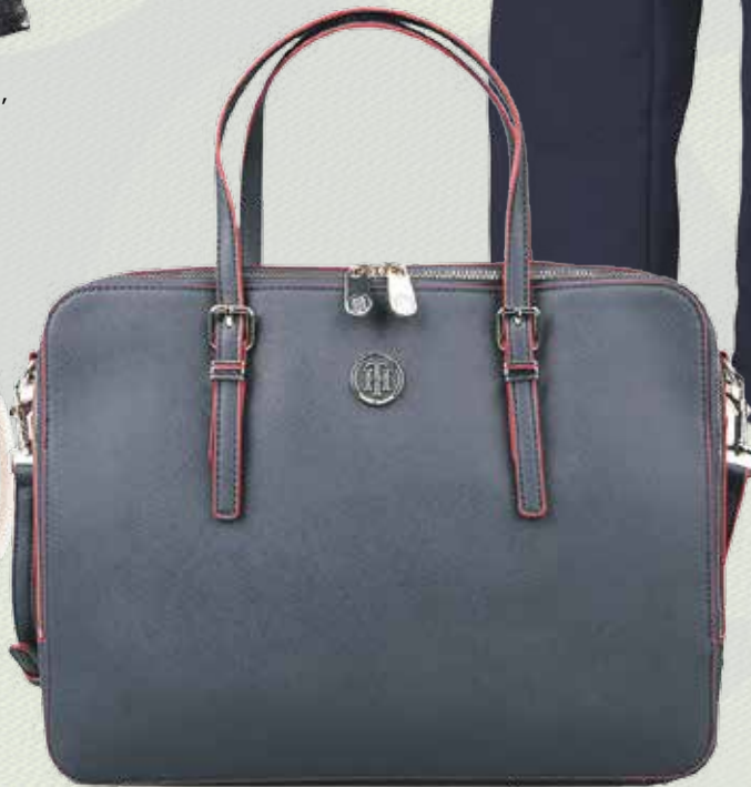
Сумка для ноутбука, 13990 руб., 9793 руб. , Tommy Hilfiger, 1 этаж Центра Галереи Чижова