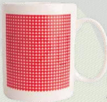
Кружка для чая с терморисунком, 392 руб., Gallery Home, 5 этаж нового Атриумного зала Центра Галереи Чижова