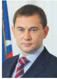
Председатель областной Думы В. И. НЕТЕСОВ