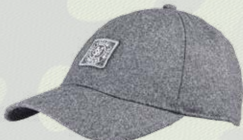
Кепка, 4980 руб., Марс O'Polo , 1 этаж Центра Галереи Чижова