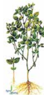
Соя Воронежская 31

Примеры успешной селекционной работы воронежцев: