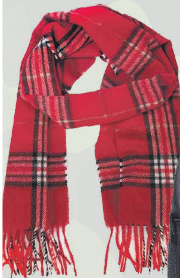
Шарф Digel, 3996 руб., 2900 руб. , «Мужской вкус», 1 этаж Центра Галереи Чижова