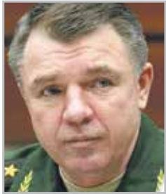
Александр ЖУРАВЛЕВ генерал-полковник, командующий войсками Западного военного округа