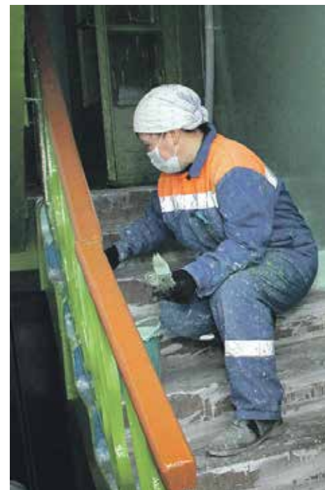
Когда в договоре управления работы по косметическому ремонту подъездов многоквартирного дома отсутствуют, требования об устранении поврежденных лакокрасочных покрытий перил и стен подъездов являются необоснованными

Требования об устранении силами управляющей организации поврежденных лакокрасочных покрытий перил и стен подъездов многоквартирного дома, если такие повреждения не приводят к угрозе обрушения и угрозе жизни и здоровью граждан и сохранности их имущества, а также не отражаются на технических характеристиках несущих конструкций, являются необоснованными. При условии, что в договоре управления, заключенном с собственниками, работы по косметическому ремонту подъездов многоквартирного дома отсутствуют.