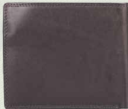
Кошелек, 2299 руб., Benetton, 2 этаж Центра Галереи Чижова