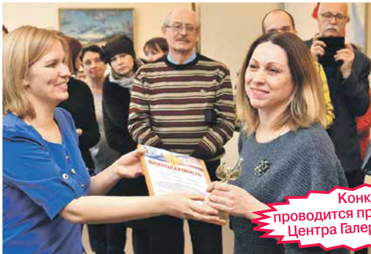
Чествование педагогов-художников прошло в торжественной атмосфере. Буря эмоций, вылитых на холсты, изначально задала отличное настроение всем участникам

В выставочном зале столицы Черноземья 13 февраля подвели итоги регионального конкурса «Педагог-художник». Дать свою оценку полотнам и обменяться опытом собралось более 100 мастеров. На этот раз корреспонденты «ГЧ» выясняли у профессионалов, что является «движущей силой» развития творчества сегодня.