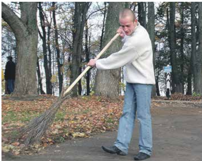
За самоуправство грозит наказание штрафом до 80 тысяч рублей, обязательными работами до 480 часов либо арестом на срок до шести месяцев

Необходимо знать, что, в силу статьи 23 Федерального закона «О садоводческих, огороднических и дачных некоммерческих объединениях граждан» от 15 апреля 1998 года № 66-ФЗ, правление садоводческого, огороднического или дачного некоммерческого объединения возглавляет председатель правления, избранный из числа членов