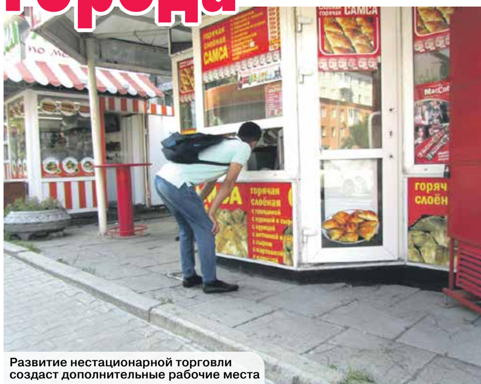
Развитие нестационарной торговли создаст дополнительные рабочие места

«Во-первых, правила меняются вместе с новым руководством, у которого свое мнение по поводу размещения НТО. Если взять по городам России – это взгляд мэра. Где-то есть требование, чтобы НТО стояли только на остановках, а где-то, наоборот, ультиматум: чтобы рядом никаких торговых павильонов. Плохо, когда такие вопросы не урегулированы федеральным законодательством, – считает он. – Когда в Воронеже этими вопросами ведало управление главного архитектора, у нас менялись требования к дизайну: одному руководителю нравятся белые киоски, приходит другой – нужны желто-зеленые. Мы считаем, что это должна решать какая-то архитектурная комиссия, но не один человек. Чтобы в привязке к облику города разрабатывались эскизы павильонов и киосков. И в этой работе участвовали бы в том числе и сами предприниматели, предлагая на согласование свои варианты. Во-вторых, слишком часто от нас требуют изменения вида. Еще не успели окупить затраты на один ремонт, заявляют, что нужно снова что-то менять. Это очень большая финансовая нагрузка на малый бизнес. Часто терялись документы, и были абсурдные, но, к сожалению, не единичные случаи, когда предприниматель вдруг узнавал, что он работает не законно и должен