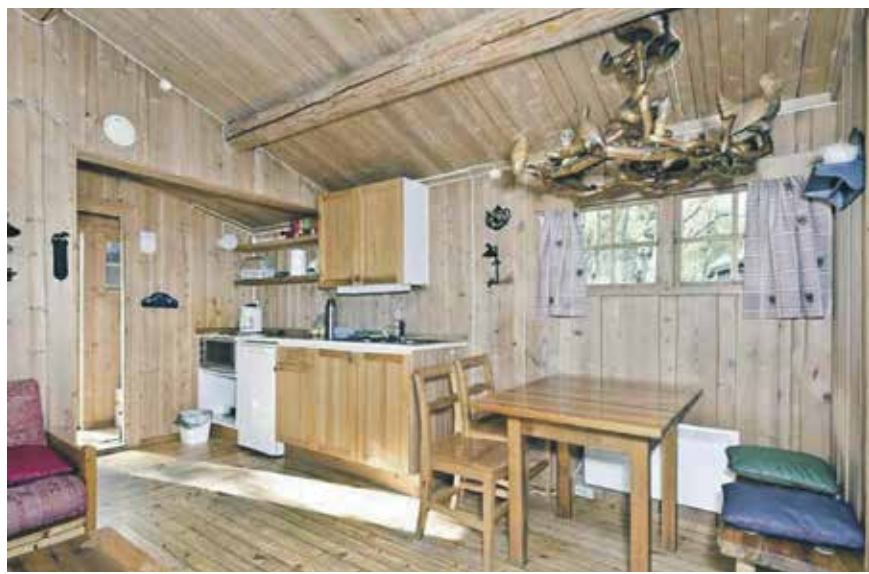
В садовый дом буквально ворвались трое члена правления во главе с председателем. Здоровые мужики, без разрешения хозяина, в грязной обуви ходили по комнатам, залазили на чердак и переписывали все электроприборы, которые им удалось найти