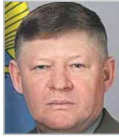
Андрей СЕРДЮКОВ генерал-полковник, командующий воздушно-десантными войсками