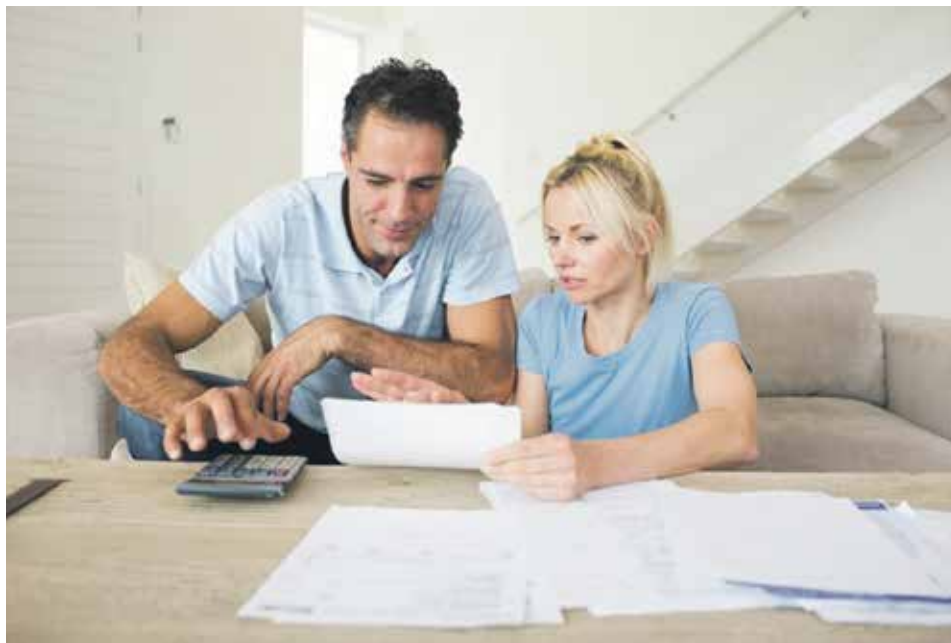
Если родители решили подарить несовершеннолетнему ребенку свои доли в квартире, им следует обратиться к нотариусу

Пленума Верховного суда РФ от 29 мая 2012 года № 9 «О судебной практике по делам о наследовании», в соответствии с пунктом 46 которого: