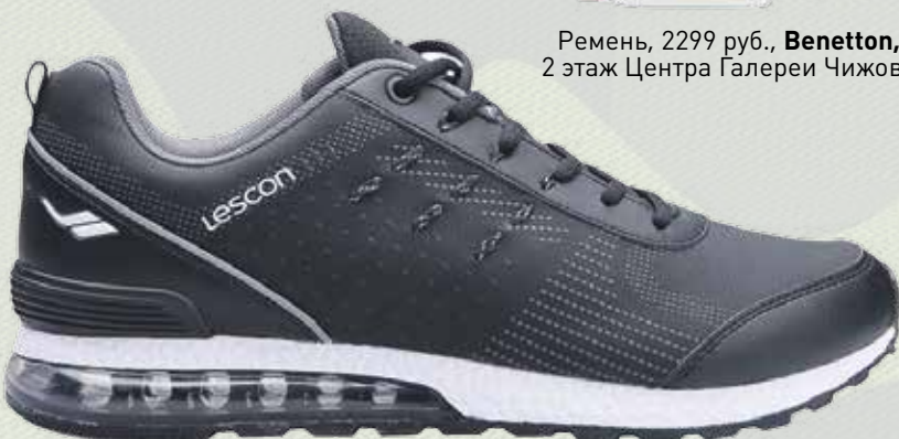
Кроссовки, 4399 руб., 2200 руб. , Lescon, 3 этаж нового Атриумного зала Центра Галереи Чижова