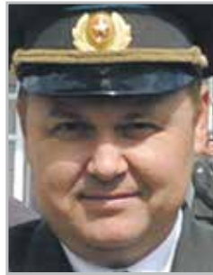
Сергей ПАЛАГИН подполковник, военный летчик, Герой Российской Федерации