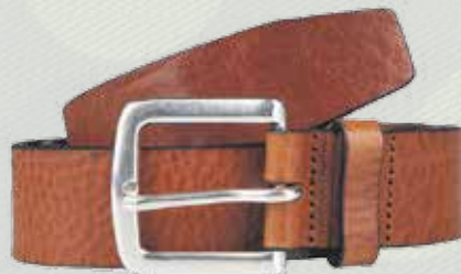
Ремень, 2299 руб., Benetton, 2 этаж Центра Галереи Чижова