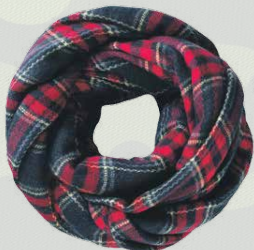
Шарф, 1799 руб., 1259 , Benetton, 2 этаж Центра Галереи Чижова

УЗНАЙ ПЕРВЫМ ОБ АКЦИЯХ, РАСПРОДАЖАХ И НОВЫХ ПОСТУПЛЕНИЯХ