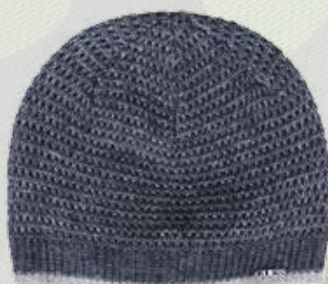
Шапка Guess, 2937 руб., 1469 руб. , +IT, 1 этаж Центра Галереи Чижова