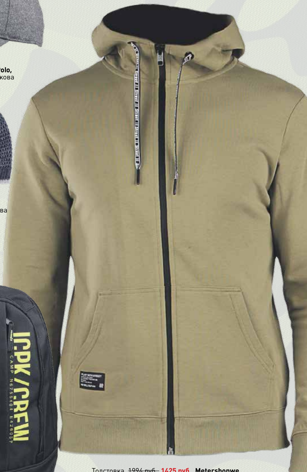
Толстовка, 1994 руб., 1425 руб. , Metersbonwe , 2 этаж нового Атриумного зала Центра Галереи Чижова