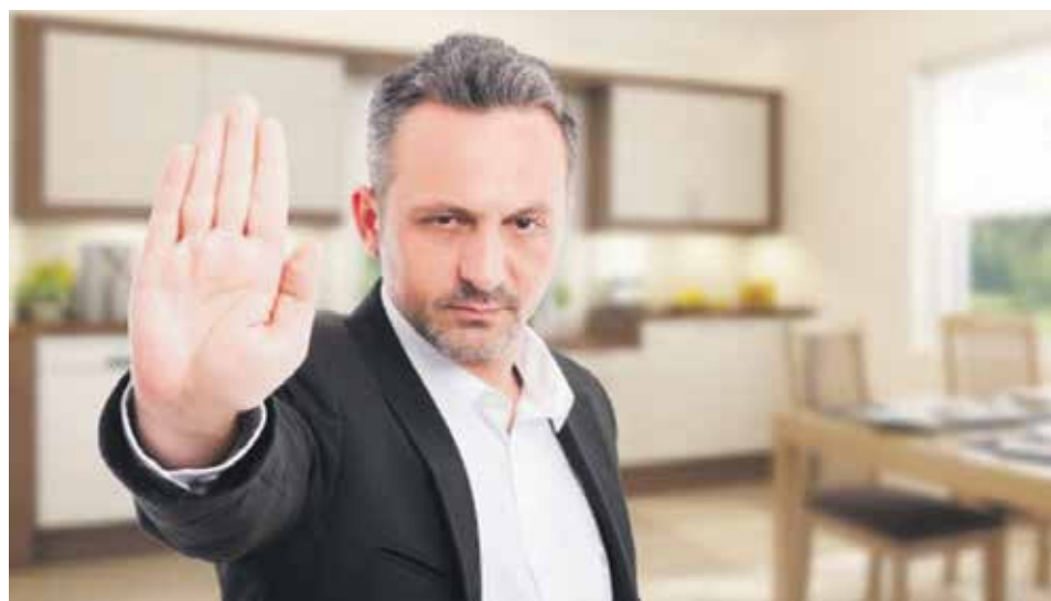
Гражданин, подавший заявление нотариусу об отказе от принятия наследства, впоследствии не вправе претендовать на него