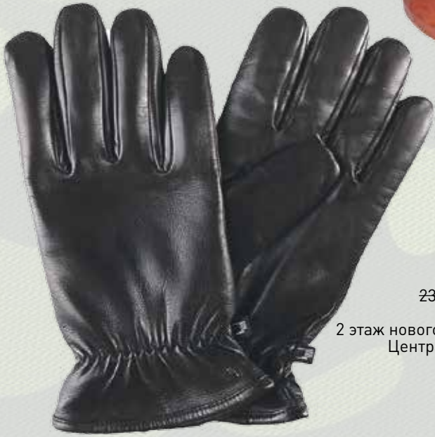
Перчатки муж. Roeski, 1610 руб., «Мужской вкус», 1 этаж Центра Галереи Чижова