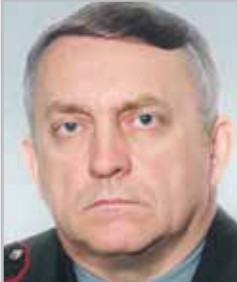
Сергей КАРАКАЕВ генерал-полковник, командующий ракетными войсками стратегического назначения