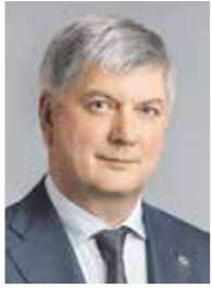
Губернатор Воронежской области А. В. ГУСЕВ