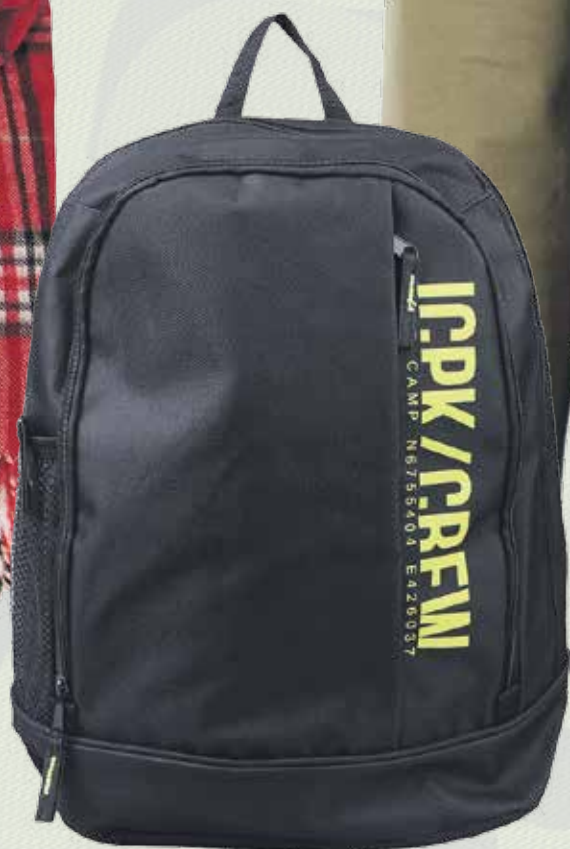
Рюкзак ІСЕРЕАК, 1699 руб., Luhta , 2 этаж нового Атриумного зала Центра Галереи Чижова