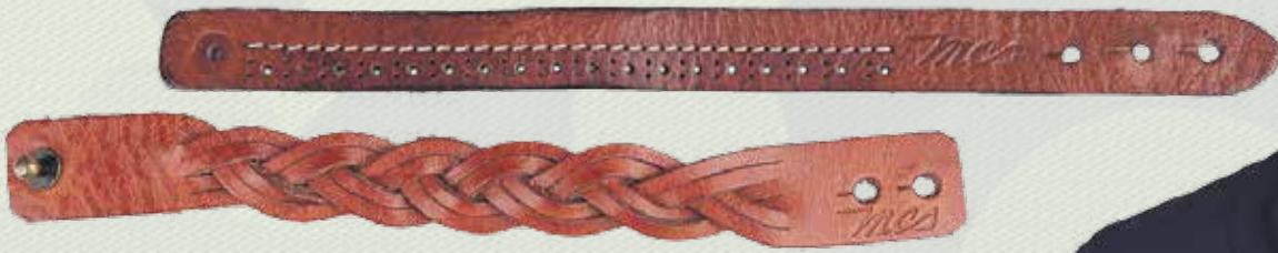
Браслеты в ассортименте, Marlboro Classics, 800 руб., «Важный аксессуар», 1 этаж нового Атриумного зала Центра Галереи Чижова