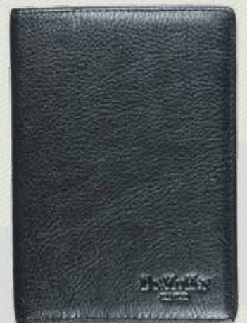
Обложка для документов Dr.Koffer, 3290 руб., 2310 руб. , «Важный аксессуар», 1 этаж нового Атриумного зала Центра Галереи Чижова