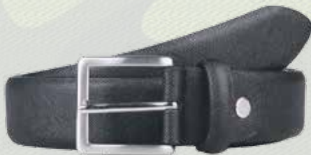
Ремень, 2490 руб., Sisley, 2 этаж Центра Галереи Чижова