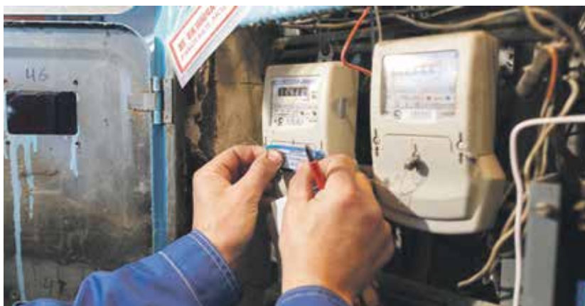
В полномочия председателя СНТ не входят вопросы подключения и прекращения подачи электроэнергии. Он вправе обратиться в суд о взыскании задолженности с граждан, а не самовольно отключать электричество