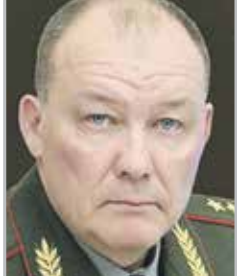
Александр ДВОРНИКОВ генерал-полковник, командующий войсками Южного военного округа