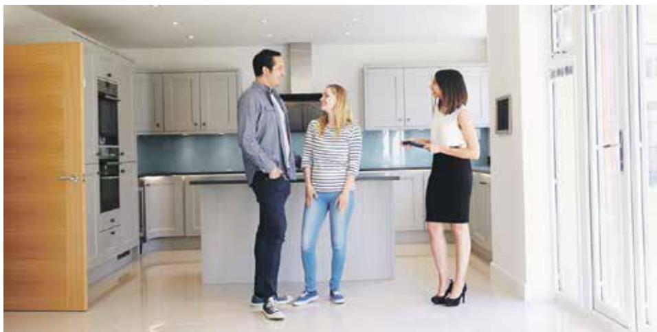
Продажа квартиры, находящейся в долевой собственности, осуществляется по соглашению всех ее участников

продать, подарить, завещать, отдать в залог свою долю либо распорядиться ею иным образом с соблюдением правил, предусмотренных статьями 250 настоящего Кодекса. В частности, при продаже доли в квартире постороннему лицу, остальные собственники долей имеют преимущественное право покупки этой доли по той же цене, за которую она продается, и на прочих равных условиях.