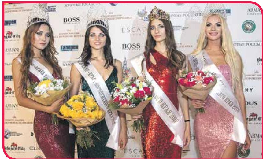
Превосходные внешние данные, духовная красота, активная жизненная позиция и постоянная работа над собой – качества, присущие каждой финалистке

Упор в шоу делался на хореографию: приятным сюрпризом стал зажигательный танец в стилизованных народных костюмах. О том, насколько выступление пришлось по вкусу зрителям можно было судить по взрывным аплодисментам. Номер завершился благотворительным аукционом: лоты девушки делали собственными руками. Вырученные средства были переданы в «Благотворительный Фонд Чижова».