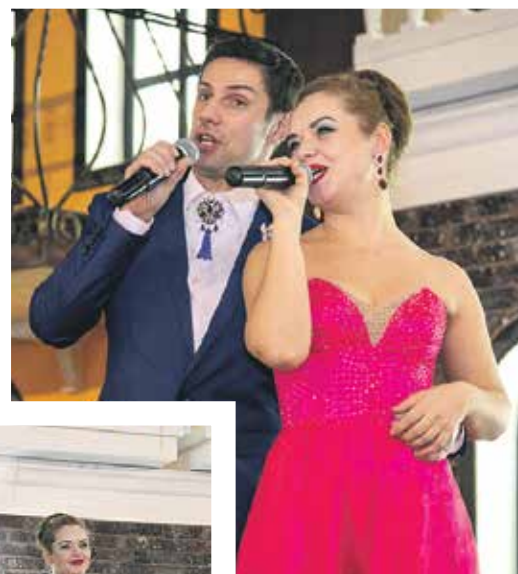
Солисты Театра оперы и балета знают, как создать новогоднее настроение