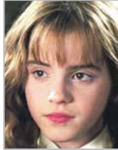
Эмма УОТСОН исполнительница роли Гермионы Грейнджер в фильме «Гарри Поттер»