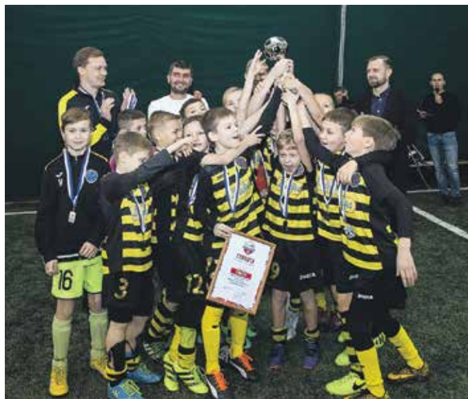
Только посмотрите на эмоции ребят из команды «Воронеж», занявшей II место! Так держать!