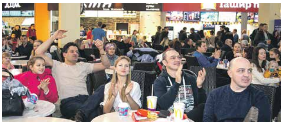
Посетители Центра Галереи Чижова услышали «Золотые хиты» за 10 дней до премьеры

Большой гала-концерт состоится в Театре оперы и балета в Старый Новый год, 13 января. Мероприятие пройдет в сопровождении симфонического оркестра под управлением maestro Станислава Вольского. Стоимость билетов – от 300 до 700 рублей.