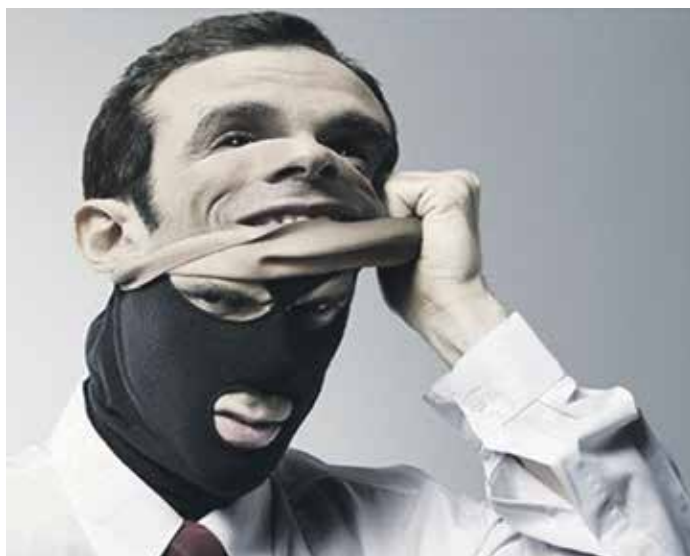
Хищение чужого имущества (денег) или приобретение права на чужое имущество путем обмана или злоупотребления доверием называется мошенничеством

По общему правилу, установленному пунктом 1 статьи 401 Гражданского кодекса РФ, лицо, не исполнившее обязательства либо исполнившее его ненадлежащим образом, несет