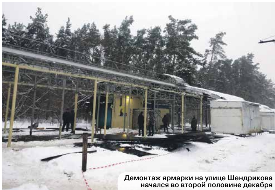
Демонтаж ярмарки на улице Шендрикова начался во второй половине декабря

Выехав на место событий и пообщавшись с населением, мы выяснили, что у людей возник далеко не один вопрос. Частные предприниматели, проработавшие здесь много лет, не знают, что делать дальше, так как судьба данного участка неизвестна. Жители волнуются, что за овощами, фруктами и печенем придется ходить в магазины, где и цены зачастую кусаются, да и продукты не всегда свежие. А еще под угрозой находится парк Оптимистов. Ведь если здесь развернется масштабное строительство, «под шумок» могут вырубить часть соснового леса.