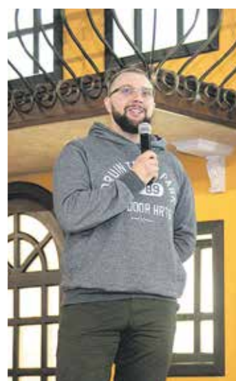
Зрители не только насладились музыкой и прекрасными голосами артистов, но и приняли участие в розыгрыше призов