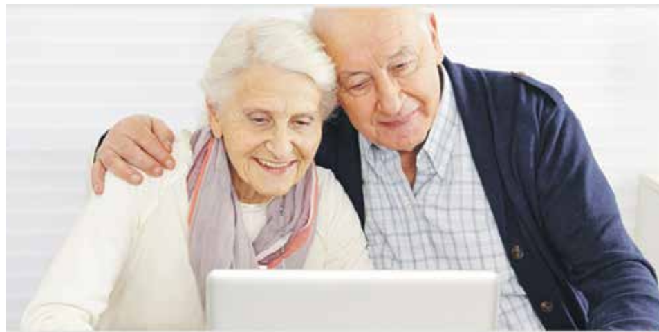
Страховые пенсии неработающих пенсионеров проиндексированы с 1 января 2019 года на 7,05%, что выше индекса роста цен за 2018 год, более чем в 2 раза

Важно помнить, что минимальный уровень пенсионного обеспечения неработающих россиян всегда будет не ниже прожиточного минимума пенсионера в регионе, где он проживает. Если размер пенсии вместе с другими причитающимися неработающему пенсионеру выплатами будет ниже прожиточного минимума, то ему будет установлена социальная доплата.