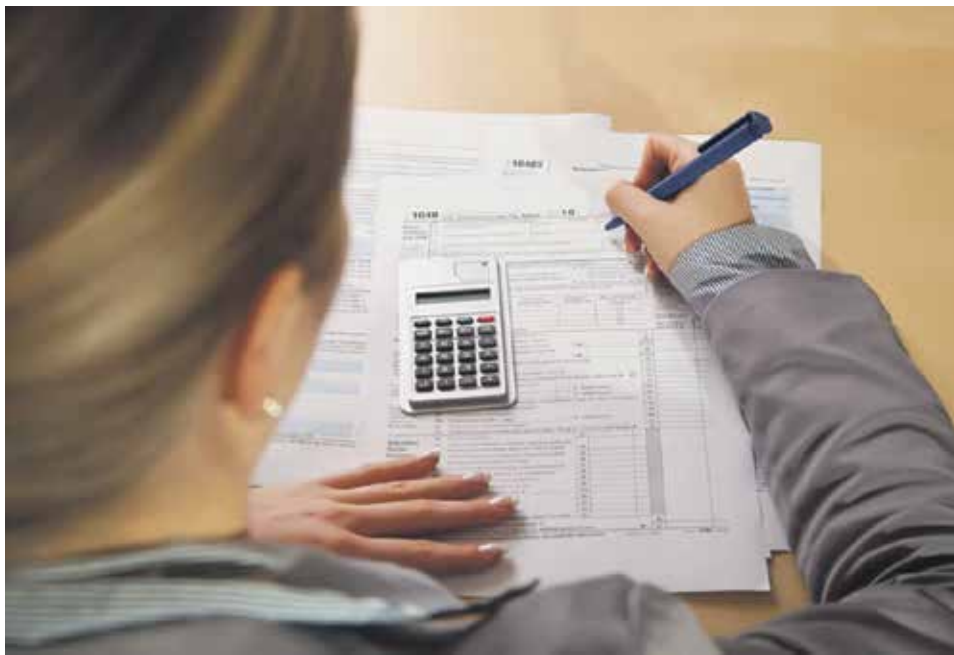
Гражданин обязан вести учет своих доходов (расходов) и объектов налогообложения, а также предоставлять в налоговый орган по месту учета декларацию

Через местные общественные приемные Председателя Партии «ЕДИНАЯ РОССИЯ» к депутату Государственной Думы Сергею Чижову регулярно поступают вопросы граждан. «ГЧ» публикует ответы на самые популярные обращения.