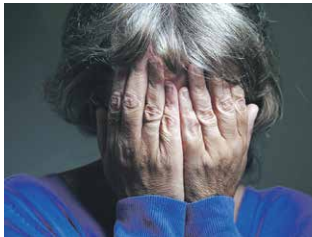
Пенсионерке не столько потраченных денег было жалко, сколько поразил цинизм, с которым вполне симпатичный молодой человек ее обманул

Правда в тот день к ним так никто и не пришел проводить ремонтно-профилактические работы. Не появились