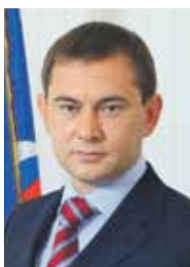
Председатель областной Думы В. И. НЕТЕСОВ