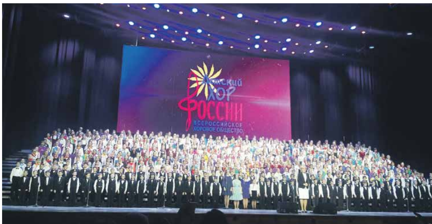
Самые талантливые дети России выступили в Кремле

лектива юные таланты уже выступили на сцене Мариинского театра, приняли участие в Церемонии закрытия XXII зимних Олимпийских игр в Сочи, провели концерт для ветеранов Великой Отечественной войны с участием композитора, народной артистки СССР Александры Пахмутовой и солистов Большого театра.