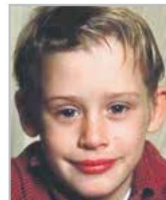
Маколей КАЛКИН исполнитель главной роли в фильме «Один дома»