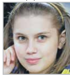
Дарья МЕЛЬНИКОВА исполнительница роли Жени Васнецовой в сериале «Папины дочки»