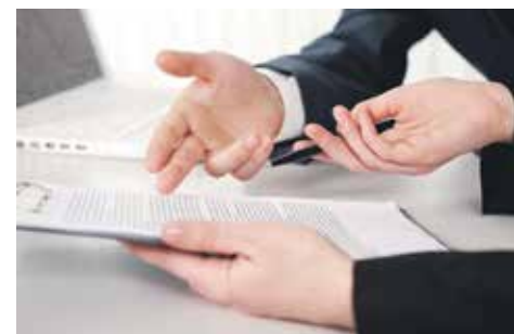
Решение собрания собственников жилья в многоквартирном доме вправе оспорить в суде жилец, не принимавший участия в собрании или голосовавший против принятия оспариваемого решения

Таким образом, согласно положениям Федерального закона о медицинском страховании, если у человека есть полис ОМС, то он, безусловно, имеет право на бесплатные приемы у врача поликлиники (это прописано и на обороте самого страхового полиса). Кроме этого, законы об ОМС дают право пациентам самим выбрать для лечения медучреждения и специалиста, врача (статья 21 Закона «Об обязательном медицинском страховании в Российской Федерации»).