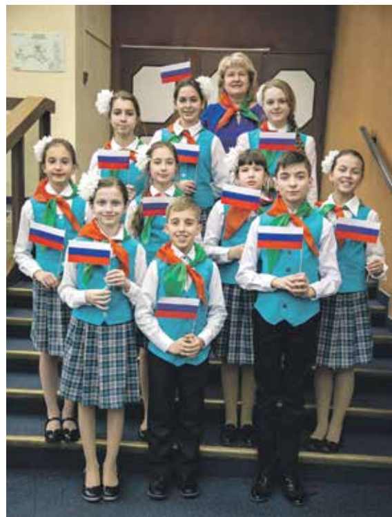
Мечта вокалистов из Приднестровской Молдавской Республики сбылась!

Детский хор России, объединяющий тысячи одаренных вокалистов из ведущих музыкальных учебных учреждений регионов, был создан в 2013 году. Попаст в него могут только ребята в возрасте от 9 до 14 лет. С момента создания уникального кол-