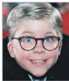
Питер БИЛЛИНГСЛИ исполнитель главной роли в фильме «Рождественская история»