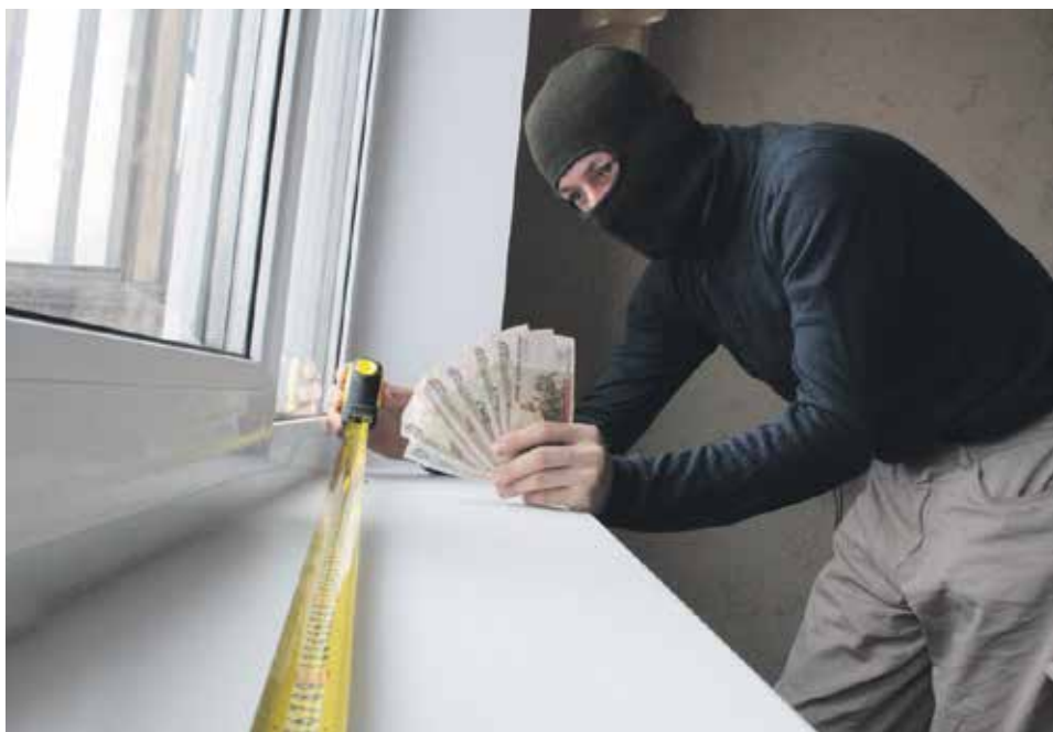
Мысль о том, что этот улыбчивый мошенник по-прежнему ходит по квартирам, ищет доверчивых людей и собирает с них деньги, не давала покоя