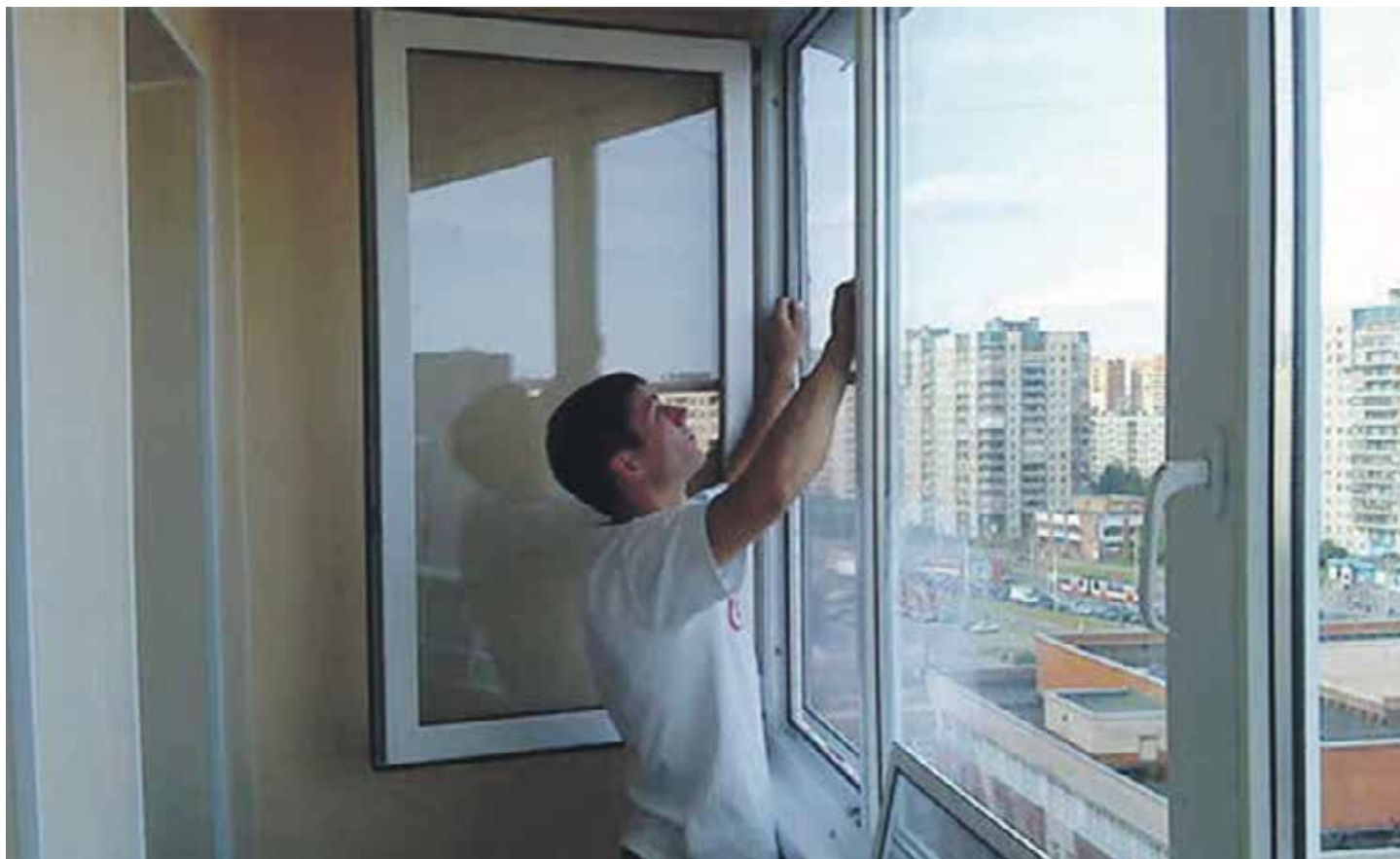
Визитер по-хозяйски ходил по комнатам, отбрасывал шторы на окнах и твердил, что резиновые уплотнители давно пора менять