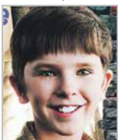
Фредди ХАЙМОР исполнитель роли Чарли Бакета в фильме «Чарли и шоколадная фабрика»