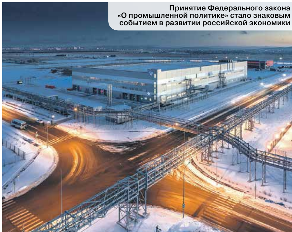
Принятие Федерального закона «О промышленной политике» стало знаковым событием в развитии российской экономики

Напомним, что в 2014 году депутаты Госдумы приняли базовый Федеральный закон «О промышленной политике». В этом документе, в частности, прописаны правила функцио-