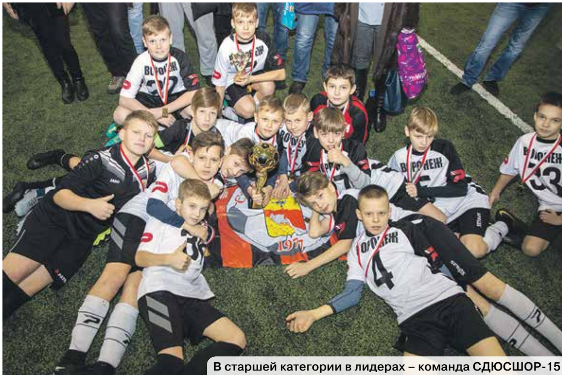
В старшей категории в лидерах – команда СДЮСШОР-15

Рождественский сочельник славен тем, что в эту пору случаются чудеса. Однако мы и сами в состоянии создать сказку для ближнего – стоит лишь сделать шаг навстречу единомышленникам. Так, организаторы завершившегося 6 января II Межрегионального детского турнира по футболу «Кубок добра», посвященного памяти героя России летчика Романа Филипова, собрали средства для ребенка, которому нужна помощь.