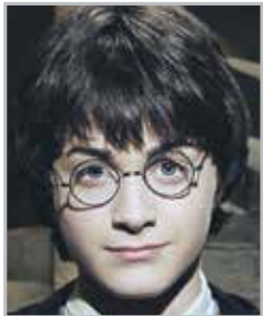
Дэниел РЭДКЛИФФ исполнитель роли Гарри Поттера в многолетней серии одноименных фильмов