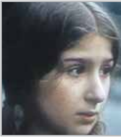
Марианна ИОНЕСЯН исполнительница роли Юли Грибковой в фильме «Гостья из будущего»