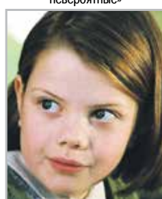
Джорджи ХЕНЛИ исполнительница роли Люси Певенси в фильме «Хроники Нарнии»