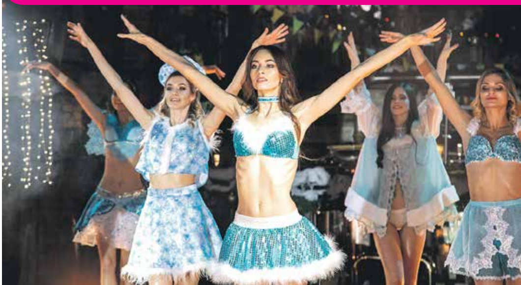
Шоу началось с кокетливого номера «Снегурочки»

26 ДЕКАБРЯ ГОСТИ АРТ-ШОУ-РЕСТОРАНА «БАЛАГАН-СИТИ» ПРЕБЫВАЛИ В ЗАМЕЧАТЕЛЬНОМ НАСТРОЕНИИ, ХОТЯ У НИХ И КРУЖИЛИСЬ ГОЛОВЫ ОТ ВЫСОКОЙ КОНЦЕНТРАЦИИ ПРЕКРАСНОГО, – ЗА ГЛАВНУЮ КОРОНУ И ПРАВО НОСИТЬ ПОЧЕТНЫЙ ТИТУЛ ПЕРВОЙ КРАСАВИЦЫ ЧЕРНОЗЕМЬЯ БОРОЛИСЬ ДЕВЯТЬ ФИНАЛИСТОК КОНКУРСА «КРАСА ВОРОНЕЖСКОГО КРАЯ – 2018».