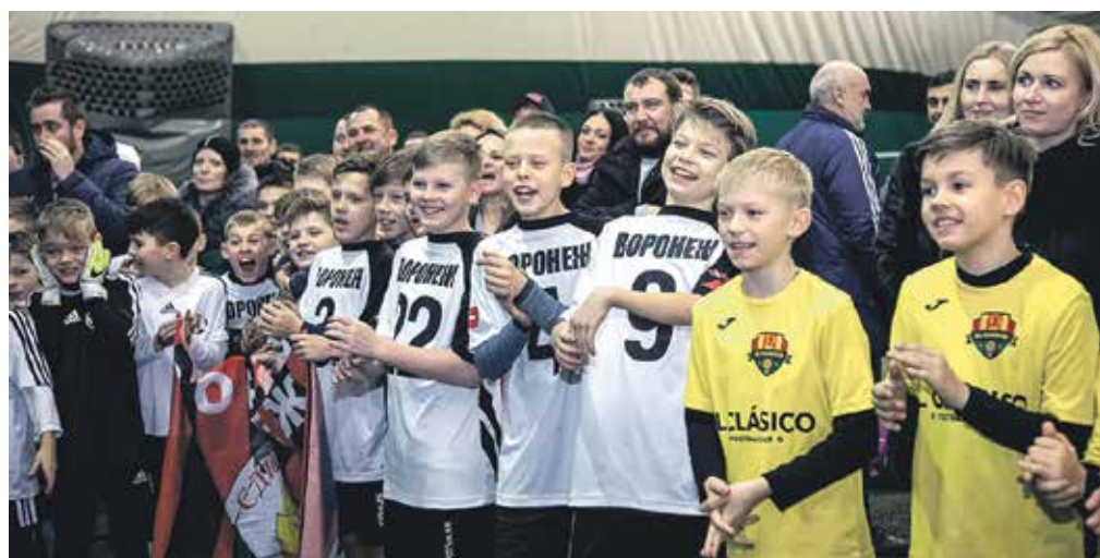
«Кубок добра»: так в чем настоящая сила?

Места в старшей категории распределились следующим образом: