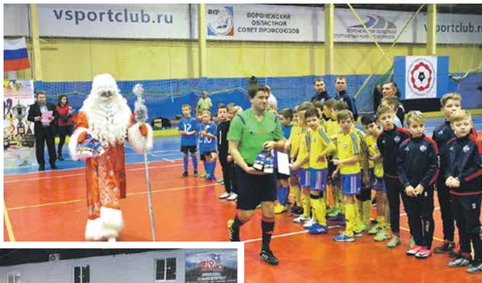
Поздравить участников турнира пришел Дед Мороз – как-никак, новогодняя пора