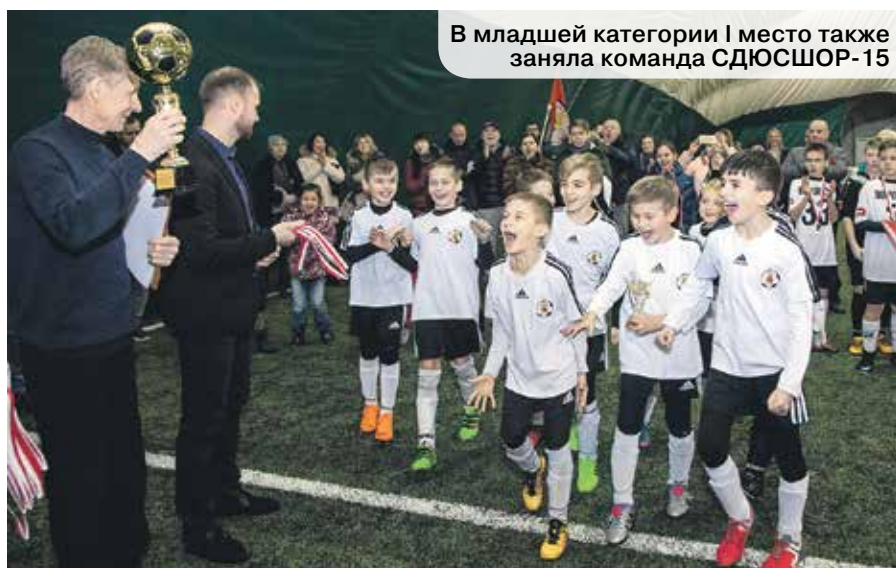
В младшей категории I место также заняла команда СДЮСШОР-15