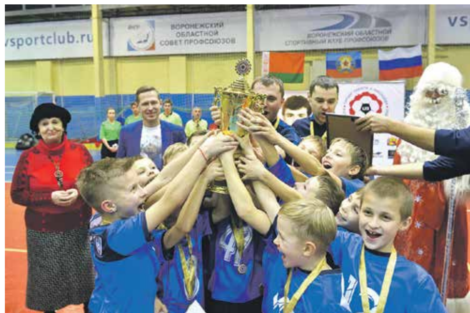
Невероятная энергетика и искренние эмоции мальчишек превратили турнир в настоящий праздник спорта

– Выражаю благодарность Центру Галереи Чижова за многолетнюю поддержку нашей команды и плодотворное сотрудничество. В этом году нам помогли с приобретением спортивной формы. В ней ребята с удовольствием провели все игры турнира. Соревнования прошли в два этапа: в отборочном туре, состоявшемся в дни осенних школьных каникул, из 16 команд Воронежа и области в финальную часть вышли 6 лучших: СДЮСШОР №15, «Труд», СШ «Факел», ФЦШ-73, «Стрела», «Химик». На первом этапе, кстати, наша команда СДЮСШОР №15 заняла первое место, выиграв у будущих чемпионов – команды «Труд». В финале ребята обыграли «Спартак-Колос» из Старого Оскола со счетом 2:0.