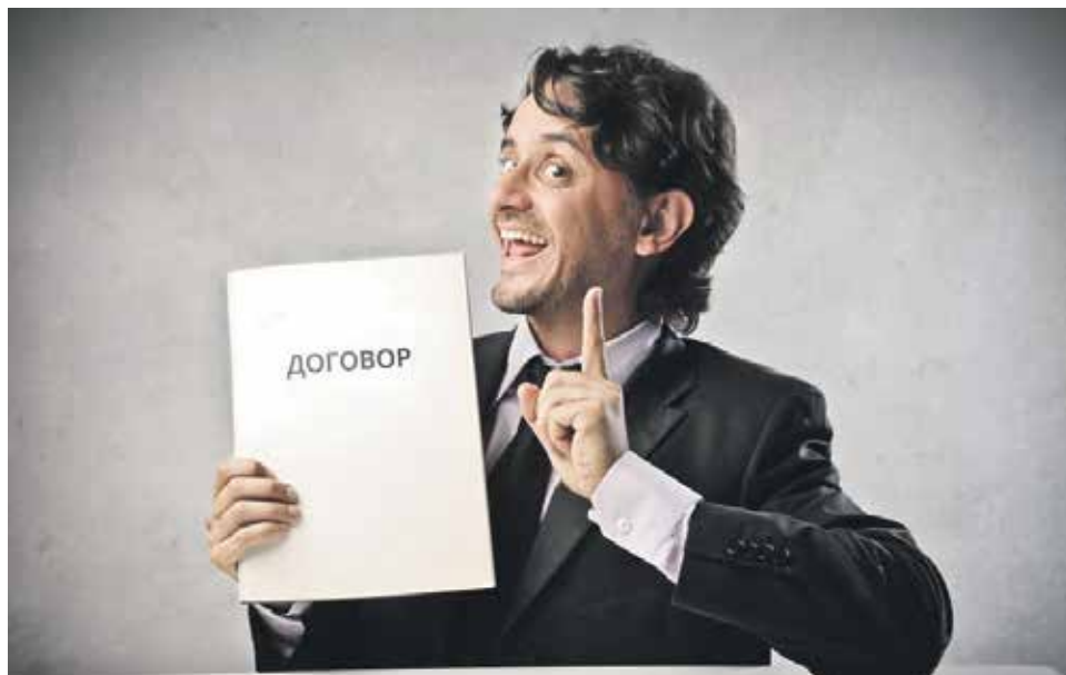
Если они подпишут договор прямо сейчас, то мастер придет уже завтра и за выходные дни все починит. И это обойдется всего в 40 тысяч рублей!