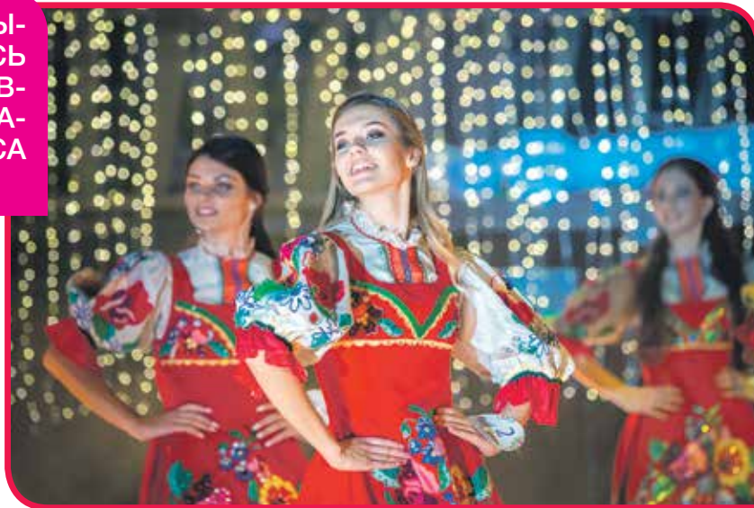
Зажигательный танец в стилизованных народных костюмах завершился взрывными аплодисментами – зрители были в восторге