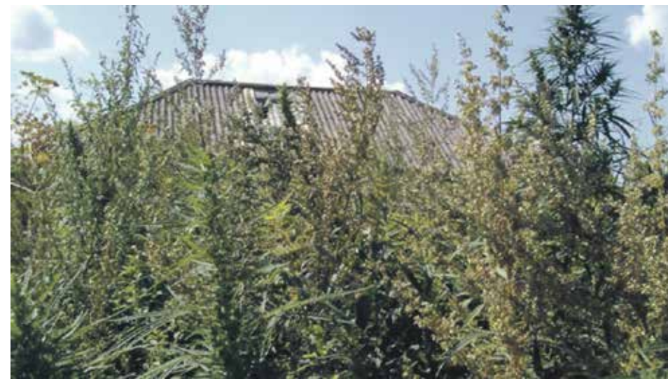
Кодексом об административных правонарушениях предусмотрена ответственность за неиспользование земельного участка, предназначенного для садоводства

Физические лица обязаны сообщать о наличии у них недвижимого