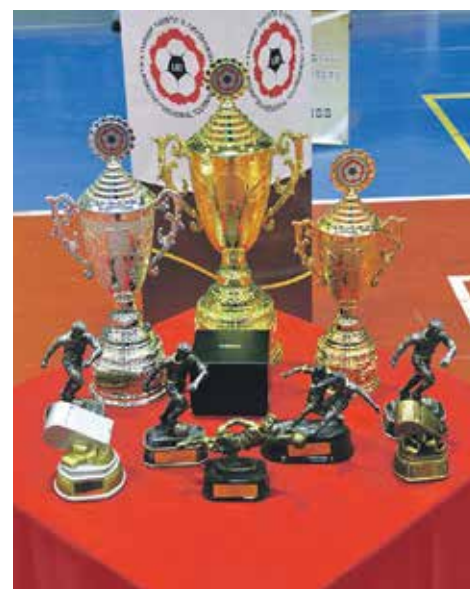
Каждый год соревноваться с воронежскими ребятами приезжают их зарубежные сверстники

В этом году сразиться с юными воронежскими футболистами приехали ребята из Минска (ФК «Минск»), Луганска («Луганская футбольная академия»), Белгорода («Зодиак» и ДЮСШ-6 «Салют»), Железногорска (СШОР) и Старого Оскола («Спартак-Колос»).