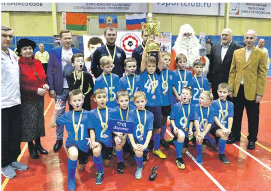
Бесспорными победителями международных соревнований стали хозяева турнира – команда «Труд»

Мальчишки, которым в этом году только исполнится по 11 лет, сразились на игровой площадке спорткомплекса «Центральный». В насыщенной эмоциями игре одновременно находились 6 полевых игроков и вратарь. Для участников главной целью была, конечно, победа. А вот организаторы хотели подарить детям запоминающуюся атмосферу спортивного праздника и вдохновить их на дальнейшее самосовершенствование. По мнению болельщиков, эти цели успешно удалось воплотить в жизнь. Свидетели увлекательных матчей смогли в полной мере прочувствовать невероятную энергетику популярной игры.