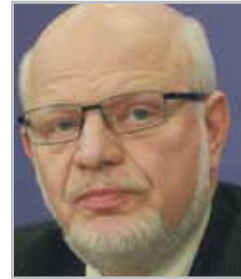
Михаил ФЕДОТОВ государственный деятель и правозащитник