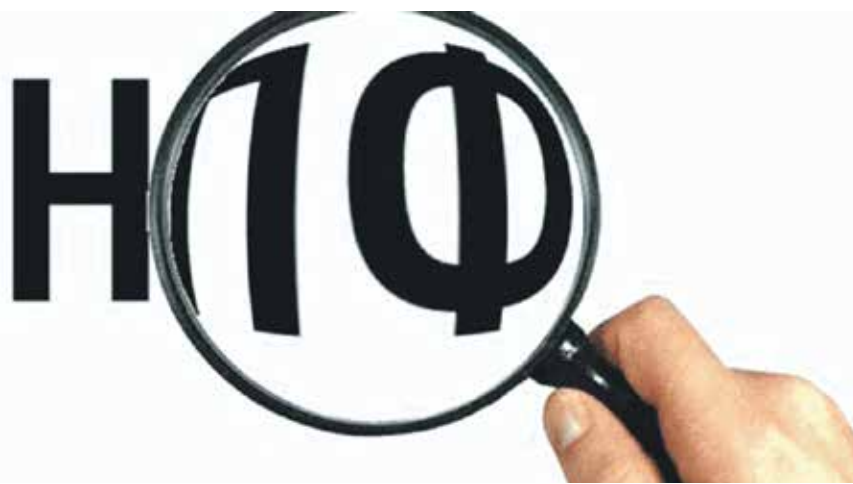
Негосударственное пенсионное обеспечение, в том числе досрочное, и обязательное пенсионное страхование осуществляется фондом на основании лицензии

нов семьи нанимателя, в том числе бывших членов его семьи (часть 4 статьи 69 Жилищного кодекса РФ). Данная норма права не устанавливает каких-либо исключений для