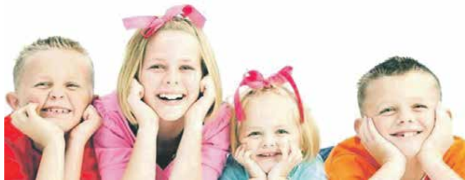
Право на получение выплаты на содержание детей носит заявительный характер. Если опекуны не обращались за выплатой с заявлением и необходимыми документами, в дальнейшем они не смогут требовать его взыскание через суд

Размер опекуновского пособия индексируется один раз в год с 1 февраля текущего года в соответствии с законом Воронежской области об областном бюджете, что на данный период составляет 7 447,87 – в городе, 9 309,84 – в сельской местности.