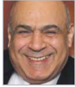
Гасан МИРЗОЕВ президент Гильдии российских адвокатов