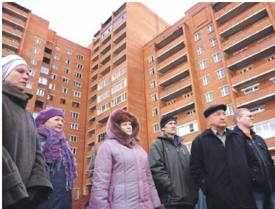
В некоторых многоэтажных домах тамбурные двери предусмотрены конструктивно и заведомо внесены в проект. Чтобы демонтировать указанную дверь, необходимо решение общего собрания собственников