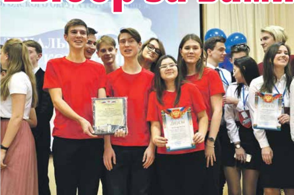
Успехи лучших представителей политически активной молодежи были отмечены благодарностями от имени депутата Государственной Думы Сергея Чижова, защищающего интересы воронежцев на федеральном уровне