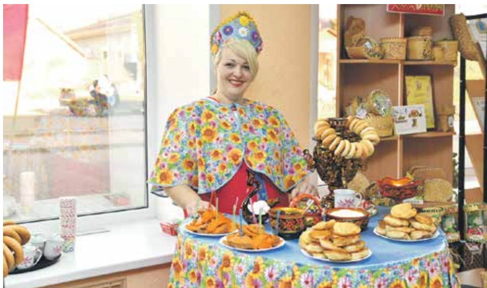
Укрепляется имидж села, улучшаются условия жизни, особое внимание уделяется популяризации сельского труда