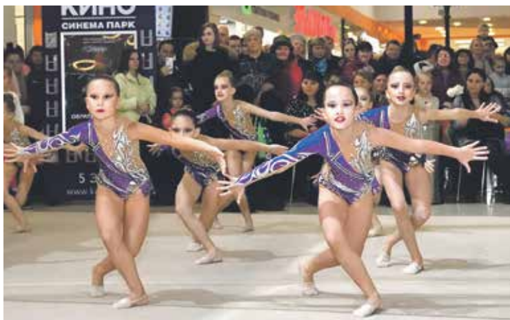
Все движения должны выполняться плавно, изменяясь в динамике