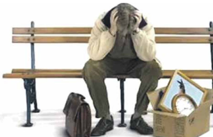
Приватизация жилого помещения возможна только при обязательном согласии на нее всех совершеннолетних членов семьи нанимателя, в том числе и бывших