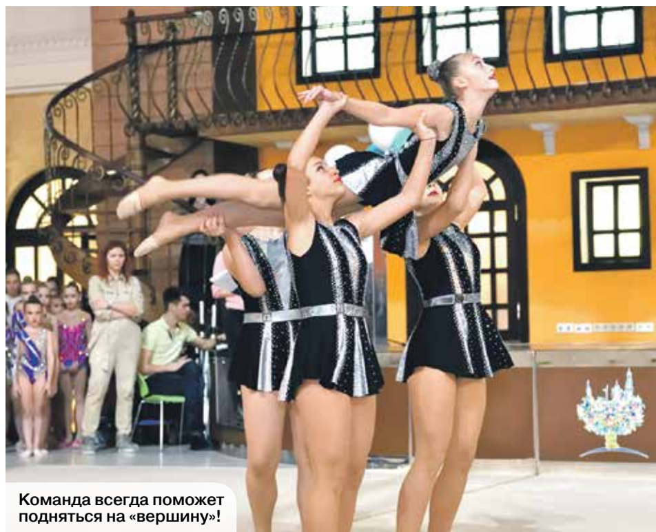
Команда всегда поможет подняться на «вершину»!