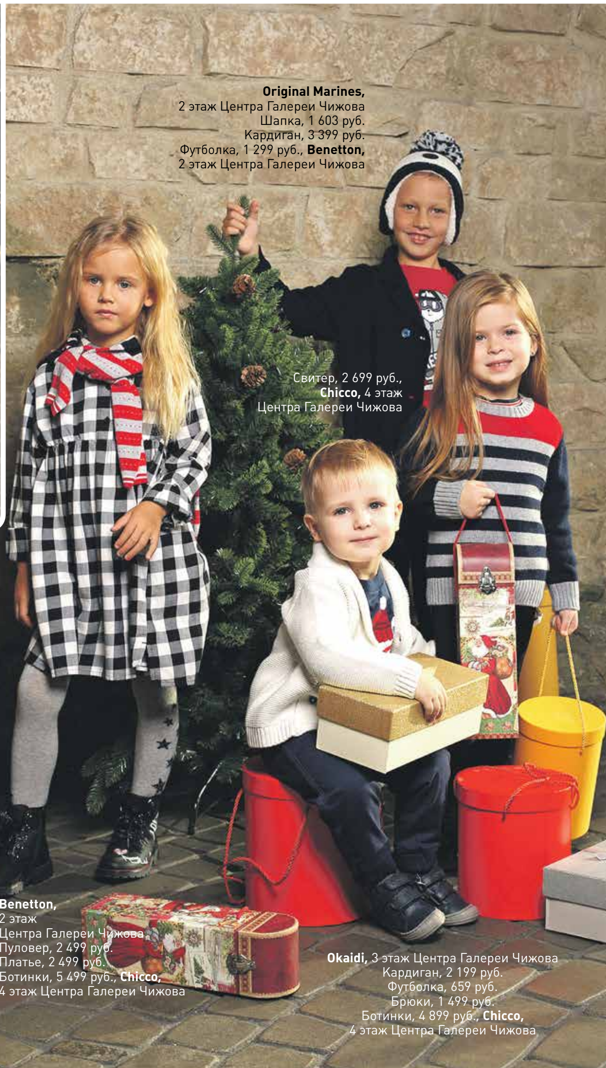
Original Marines , 2 этаж Центра Галереи Чижова Шапка, 1 603 руб. Кардиган, 3 399 руб. Футболка, 1 299 руб., Benetton , 2 этаж Центра Галереи Чижова