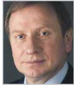
Игорь ПОЛЯКОВ президент Адвокатской палаты Москвы