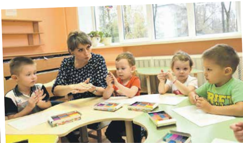
В игре у малышей рождается огонек любознательности