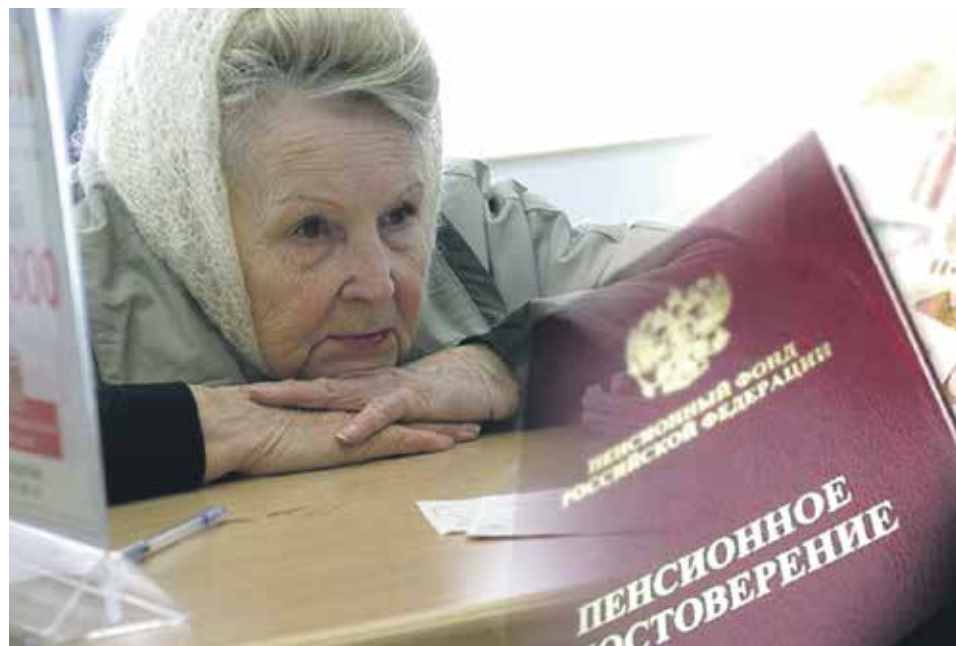
Перерасчет фиксированной выплаты к страховой пенсии по старости или по инвалидности производится без истребования заявления