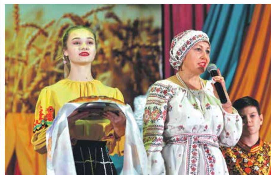
Для эффективного функционирования и поддержания высокого уровня конкурентоспособности отрасль нуждается в активном содействии со стороны государства

В этом году урожай порадовал новыми достижениями. Собрано порядка 5 миллионов тонн зерновых, 6,5 миллионов тонн свеклы, свыше миллиона тонн подсолнечника и кукурузы. Площадь пашни - 2, 6 % от общей по стране. До 2012 года для реализации в сфере АПК заявлено 55 инвестиционных проектов с объемом средств, превышающим сумму 120 миллиардов рублей.