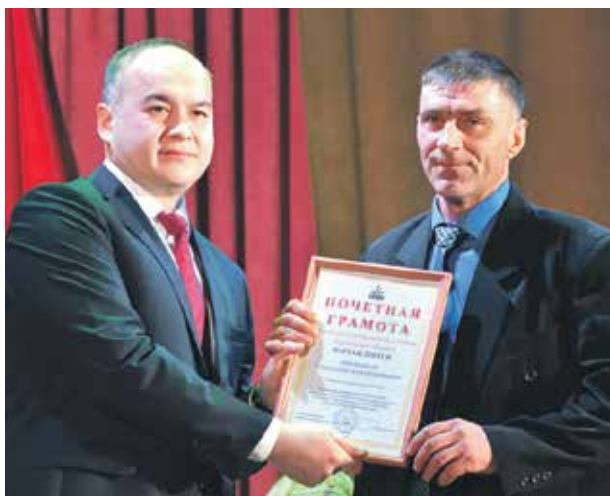
За достижение высоких результатов в производственной деятельности передовики получают заслуженные благодарности

развитие отрасли вносит депутат Государственной Думы Сергей Чижов. При деятельном участии парламентария в текущем году региону для поддержки сельхозпроизводителей направлено 7,6 миллиардов рублей. На строительство 6,5 тысяч квадратных метров жилья для селян - 648, 3 миллиона рублей. Социальные выплаты получили 64 семьи. В рамках программы развития сельских территорий в регионе