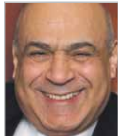
Генри РЕЗНИК известный в России правозащитник, кандидат юридических наук

Предстоит сделать остановку в стремительном темпе жизни. Причина – повышенная усталость, эмоциональная опустошенность. Пересмотрите рабочий график: найдите возможность для занятий спортом и активного отдыха. Источником бодрости станет и романтическое общение с кем-то из представителей знака Рыбы.