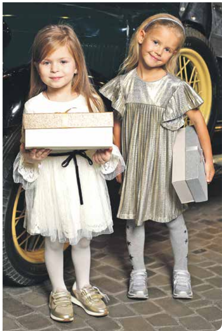
Слева: Платье, 3 949 руб., Original Marines , 2 этаж Центра Галереи Чижова Кроссовки, 5 098 руб., Chicco , 4 этаж Центра Галереи Чижова