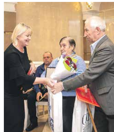
Крепкая семья – непрерывный труд, а удачный брак – тот, что выдерживает долгие годы