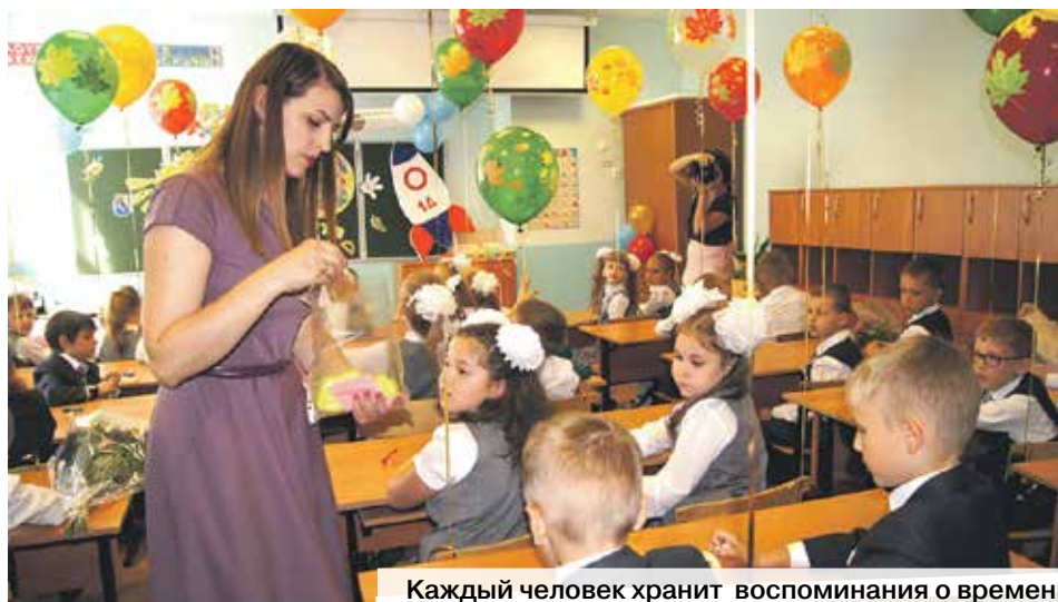
Каждый человек хранит воспоминания о времени, проведенном в школе. У бунинцев эти моменты связаны с любимыми учителями. Их труд заслуживает глубокого признания и благодарности