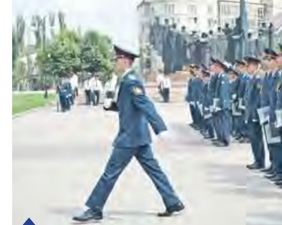
Для вуза это первый выпуск офицеров, подготовленных по новой учебной программе бакалавриата. Выпускники направляются служить в 27 регионов страны. Но уже осенью в институте ожидается пополнение: здесь будут учиться ребята почти из всех областей России

Чуть ранее мы выпустили тех на рей, сегодня состоялся выпуск лейтенантов внутренней службы по специализации «юриспруденция». У всех ребят – очень хорошие перспективы. Это профессионалы нового поколения, знания и навыки которых имеют важное значение в условиях реформирования правоохранительной системы. Особенно если учесть, что наш вуз является единственным в уголовно-исполнительной системе, осуществляющим подготовку инженерно-технических кадров. Более того – в России запущена целевая программа «Глонасс-2020». Это значит, ребята будут востребованы и в других отраслях народного хозяйства.