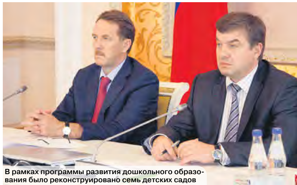
В рамках программы развития дошкольного образования было реконструировано семь детских садов