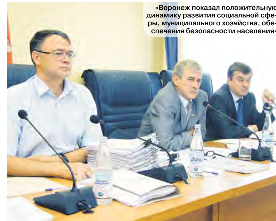
«Воронеж показал положительную динамику развития социальной сферы, муниципального хозяйства, обеспечения безопасности населения»