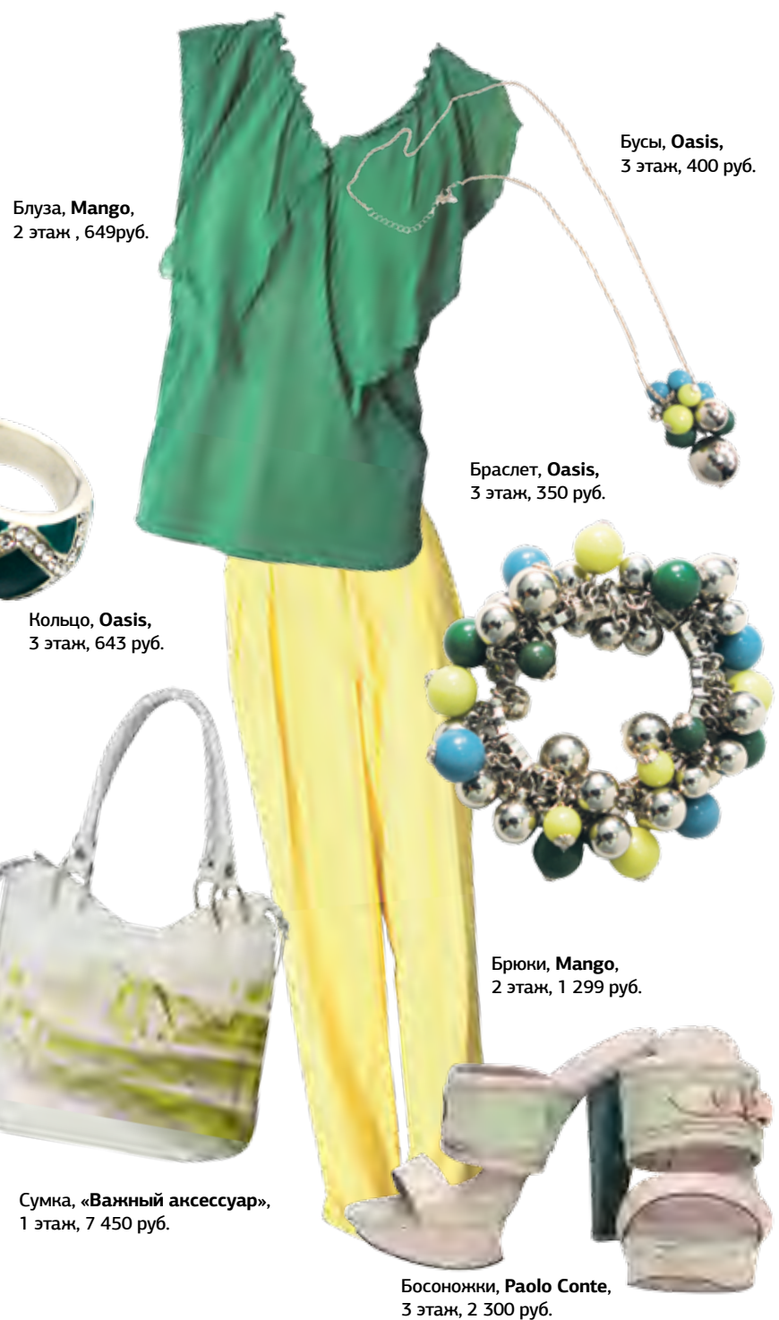
Блуза, Mango, 2 этаж, 649 руб.

Стиль Колорблок (Colorblock) требует от модников смелости и умения смешивать в одном комплекте несколько ярких цветов. Краски этого стиля как раз очень подходят нашей сочной блондинке и рождают неповторимый летний коктейль.