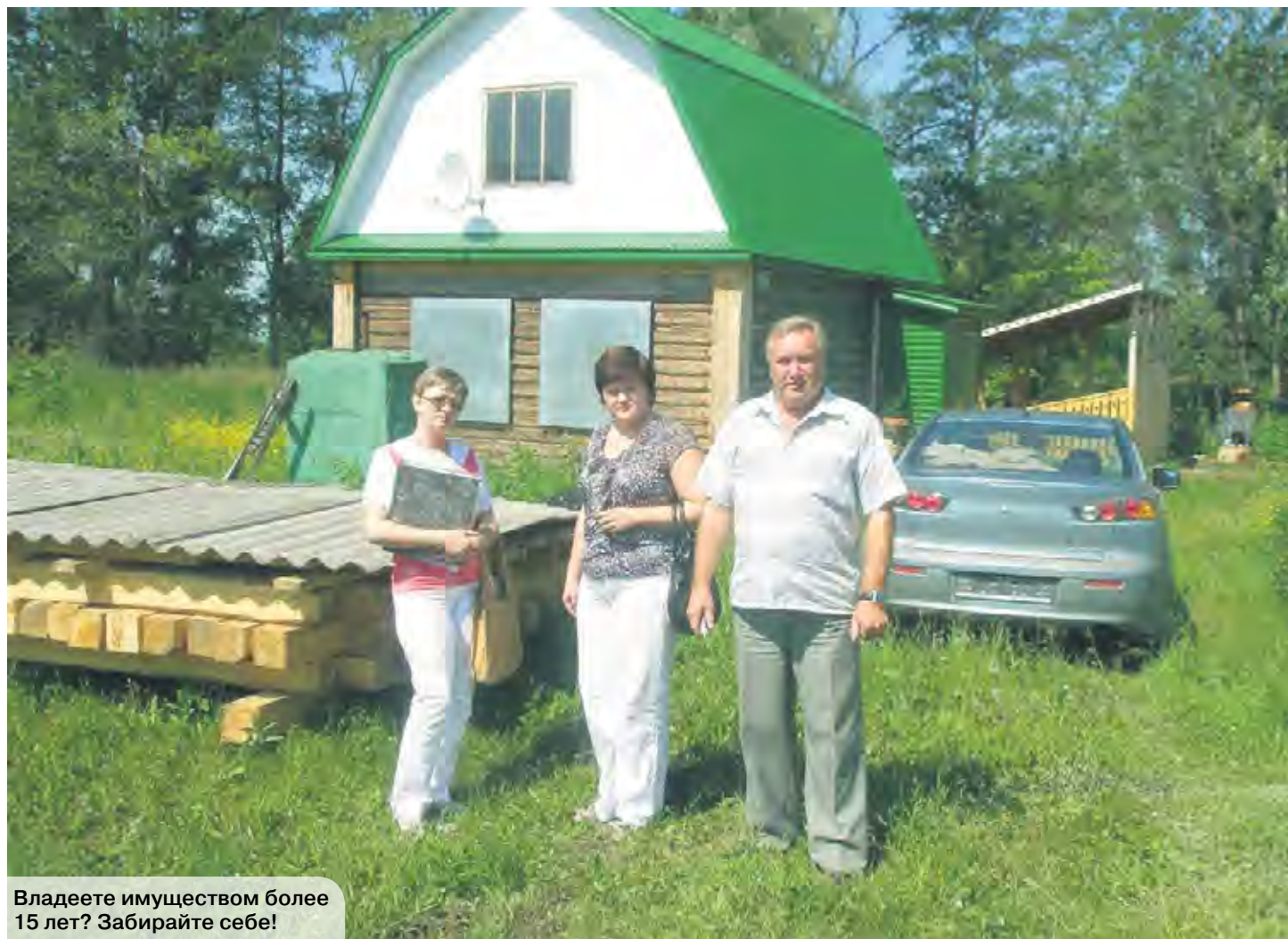
Владеете имуществом более 15 лет? Забирайте себе!