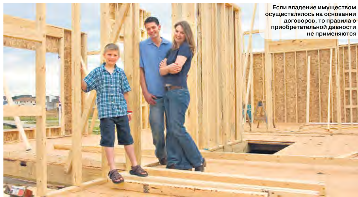
Если владение имуществом осуществлялось на основании договоров, то правила о приобретательной давности не применяются

Лицо, считающее, что стало собственником имущества в силу приобретательной давности, может обратиться в суд с иском о признании за ним этого права. Ответчиком по данному иску будет прежний владелец. В случаях, когда послед-