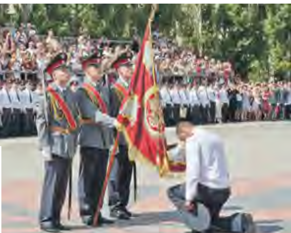
Один из самых трогательных моментов церемонии – прощание со Знаменем института

В минувшую субботу состоялся выпуск офицеров Воронежского института МВД, который по праву можно считать особенным. Он не только юбилейный – 30-й по счету для одного из самых авторитетных вузов в системе Министерства внутренних дел. В этот день получили путевку в профессиональную деятельность первые лейтенанты полиции.