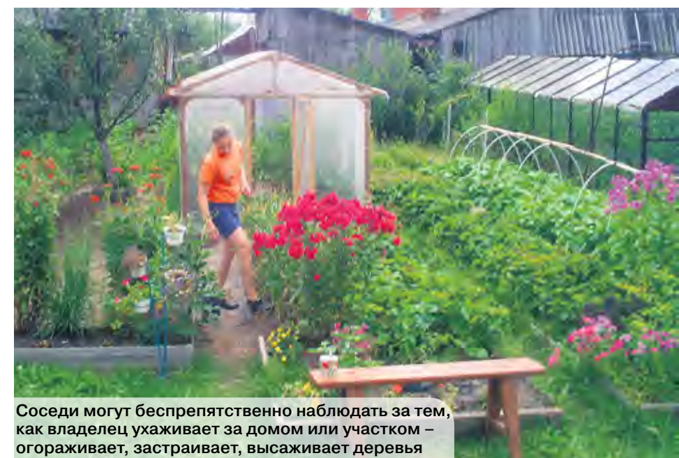
Соседи могут беспрепятственно наблюдать за тем, как владелец ухаживает за домом или участком – огораживает, застраивает, высаживает деревья

В первом случае имеется в виду, что владелец использует вещь по назначению, поддерживает ее в исправном состоянии, при необходимости осуществляет ремонт своими силами или