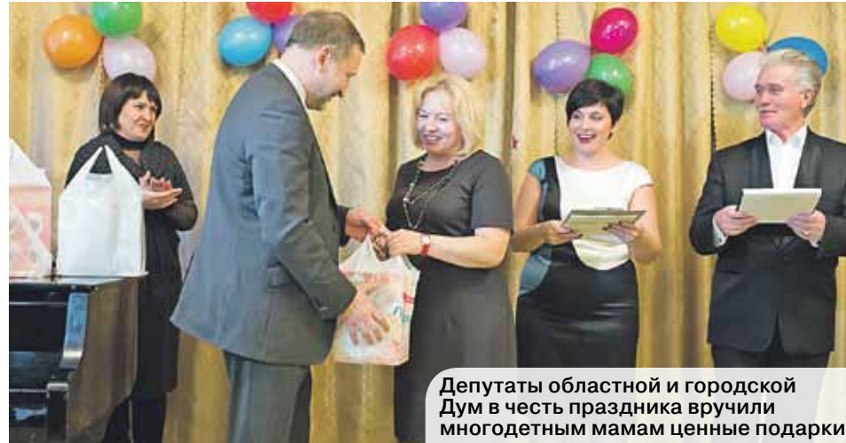
Депутаты областной и городской Дум в честь праздника вручили многодетным мамам ценные подарки

Счастливая доля многодетной мамы В центре социального обслуживания Левобережного района «Жемчужина» в честь праздника организовали встречу 10 многодетных семей. Помимо праздничной программы, которую для мам подготовили их дети, женщин также поздравили депутаты областной и городской Дум, вручив им ценные подарки.