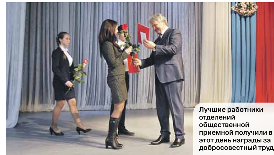
Лучшие работники отделений общественной приемной получили в этот день награды за добросовестный труд

Планируется, что до сентября 2017 года жители аварийного жилья переедут в новые квартиры. 27 ноября соответствующее постановление подписал председатель Правительства Дмитрий Медведев. В числе первоочередных задач, необходимых для достижения этой цели, – государственное финансирование Фонда содействия реформированию ЖКХ в 2016–2017 годах в размере 10 миллиардов рублей ежегодно. Установлено также перераспределение взносов в фонд в сторону увеличения в 2013 году – до 13 миллиардов рублей, в 2015 году – до 20 миллионов рублей за счет сокращения взноса в 2014-м.