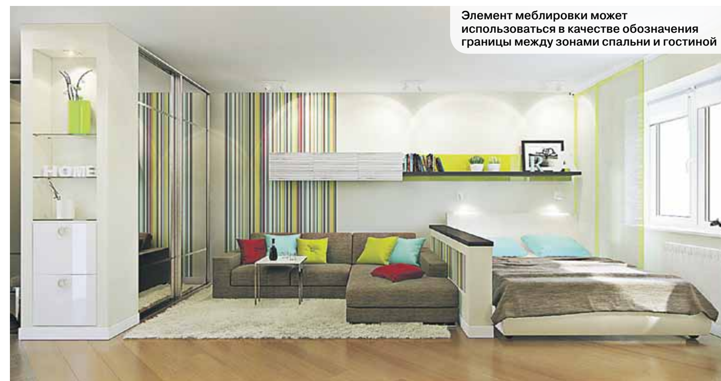
Элемент мебели может использоваться в качестве обозначения границы между зонами спальни и гостиной

К сожалению, фактический метраж жилья не зависит от приемов визуального расширения пространства. Поэтому, как бы сильно ни хотелось, в двухкомнатной квартире не получится обособленно разместить и детскую, и кабинет, и гардеробную, и домашний тренажерный зал. Однако при известной доле желания каждое помещение можно превратить в комнату-трансформер, соединив в пределах одного пространства, например, спальню и гостиную.