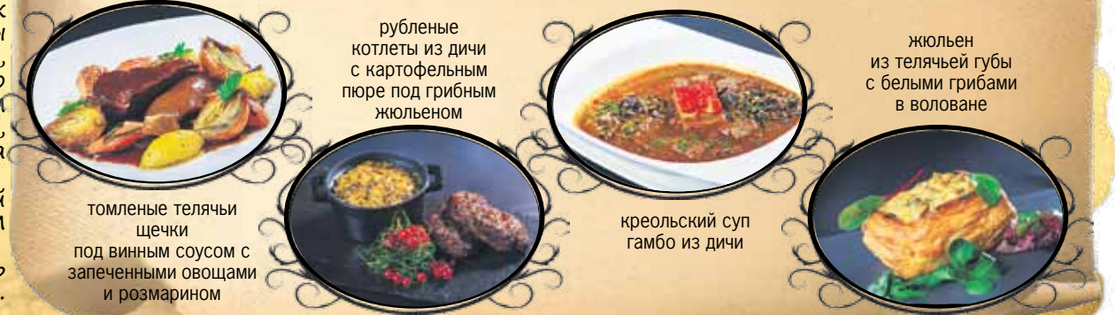
томленые телячьи щечки под винным соусом с запеченными овощами и розмарином

– только здесь можно отведать такие блюда, как: