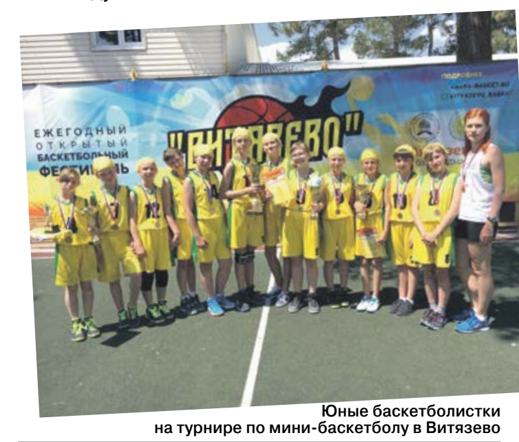
Юные баскетболистки на турнире по мини-баскетболу в Витязево

В субботу, 12 августа, в России будет отмечаться День физкультурника. Треть наших граждан имеет прямое отношение к этому празднику. Сейчас в стране на постоянной основе спортом занимается 34 % населения. И что самое главное – число приверженцев здорового образа жизни с каждым годом растет. Так, в Воронежской области по итогам прошлого года в движение любителей спорта влились 39,7 % населения. К слову, в целом для страны этот показатель целевой – его планируется достигнуть только к 2020 году.