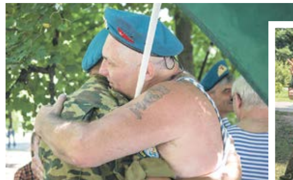
Таких сердечных встреч в этот день в Воронеже было немало