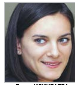
Елена ИСИНБАЕВА 2-кратная олимпийская чемпионка, обладательница 28 мировых рекордов

Предстоящая неделя будет наполнена настолько сильными романтическими переживаниями, что многим Овен покажется правильной идеей броситься в омут с головой. Тем же, кто сумеет сохранить благоразумие, ждет награда – первых успех в бизнесе или чрезвычайно выгодный контракт. Не забывайте о друзьях: Вы можете стать настоящим волшебником для знакомого-Водолея.