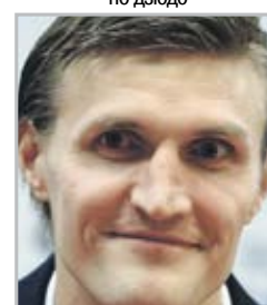
Андрей КИРИЛЕНКО Заслуженный мастер спорта, президент Российской Федерации баскетбола

Если у вас есть проект, на запуск которого вы до сих пор не можете решиться, сейчас – самое время. Ваша харизма, как никогда, сильна, а смелость поступков и суждений помогут оставить за бортом даже самого серьезного конкурента. Свободное время, если оно появится, а также неистощенную энергию, потратьте во флирте с представителем знака Стрелец или на занятия спортом.