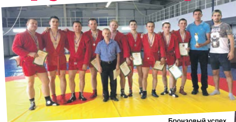
Бронзовый успех самбистов на Спартакиаде в Нововоронеже