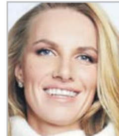
Светлана КУЗНЕЦОВА Теннисистка, Заслуженный мастер спорта России, бывшая вторая ракетка мира

Роман с представителем знака Дева не обещает быть долговечным, особенно, если будет основываться только на физическом притяжении. Зато карьерный фронт порадует стабильностью: результаты, достигнутые Вами в ближайшее время, и удовлетворение принесут, и будут оценены руководством. Родителям-Близнецам стоит посвятить время подготовке чада к учебному году.