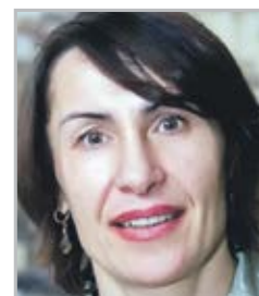
Любовь ЕГОРОВА Лыжница, 6-кратная олимпийская чемпионка, Заслуженный мастер спорта РФ, Герой РФ

Бизнес-гороскоп говорит о том, что в какой-то из сфер жизни Вы никак не можете преодолеть череду неудач. Остановитесь и отдохните. В любви ваши желания точно сбудутся. Это вопрос времени. Кто-то из знакомых Близнецов посмотрит на вас по-новому и увидит неочевидные ранее качества. Неделя располагает к новым знакомствам, посещение ресторанов, размеренному отдыху на свежем воздухе.