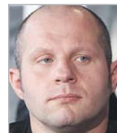
Федор ЕМЕЛЯНЕНКО Заслуженный мастер спорта по самбо и мастер спорта международного класса по дзюдо

Туманные, но вместе с тем будоражащие фантазию перспективы, могут отвлечь Вас от прозы бытия, а вместе с ней – и от мелких, но важных обязательств. В этой ситуации постарайтесь сохранить репутацию. Даже если попытка закончится провалом, пилюлю подсластит крупные финансовые поступления. В конце недели высока вероятность встречи с бывшей любовью – не поддавайтесь на провокации.