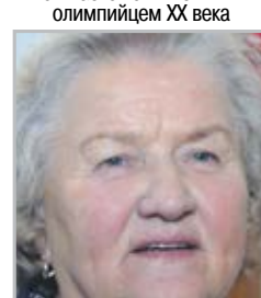
Лидия СКОБЛИКОВА Единственная 6-кратная олимпийская чемпионка в конькобежном спорте

Перестаньте предаваться философским размышлениям и предпримите, наконец, конкретные действия. Сейчас хорошее время для развития профессиональных компетенций. Поначалу будет нелегко, навыки будут осваиваться с большим трудом. Но есть и хорошая новость – Вы настолько популярны у противоположного пола, что можете встретиться одновременно с двумя, а может и тремя партнерами.