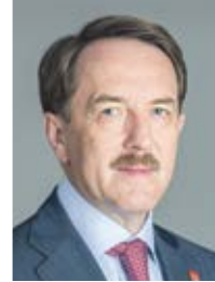
Губернатор Воронежской области А. В. ГОРДЕЕВ