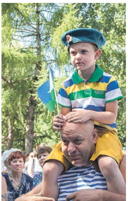
Многие ветераны ВДВ пришли на торжество с семьями