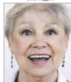
Лариса ЛАТЫНИНА Гимнастка, 9-кратная олимпийская чемпионка, считается сильнейшим олимпийцем XX века

Забудьте о заведомо нерешаемых проблемах и ритуальных вопросах. Да и зачем ломать над этим голову, если Вы чувствуете, что на работе в буквальном смысле незаменимы. Будьте осторожны, вам предстоит открыть для себя неизвестную грань характера близкого человека. Возможно именно он впоследствии даст Вам повод гордиться и восхищаться им.