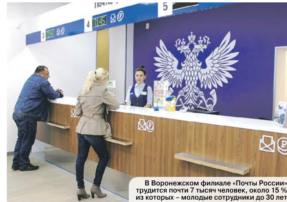
В Воронежском филиале «Почты России» трудится почти 7 тысяч человек, около 15% из которых – молодые сотрудники до 30 лет

Еще одно нововведение – мобильный почтово-кассовый терминал (МПКТ). Он состоит из смартфона и контрольно-кассовой машины для печати фискальных чеков. В наш филиал уже поступило 500 таких аппаратов. Проект по приему платежей на дому запущен в Воронежской области в марте 2017 года. Благодаря ему жители региона смогут оплатить «коммуналку», налоги, штрафы и