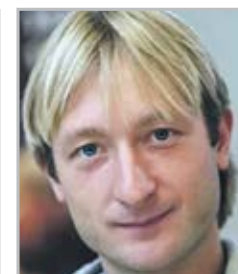
Евгений ПЛЮЩЕНКО 2-кратный олимпийский чемпион, единственный фигурист, завоевавший четыре олимпийские медали

Ваше желание возглавить команду не совпадает с реальными возможностями: неуменно объективно оцените окружающую обстановку – корни всех Ваших бед. Чтобы отвлечься от неприятных эмоций, примоститесь к коллеге-Рыбе: он пойдет с вами на любую авантюру. Тем, кто успел обзавестись тайным служебным знаком, следует быть начеку: вокруг Вас сгущается ореол из слухов и сплетен.