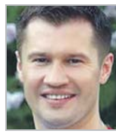
Алексей НЕМОВ Выдающийся гимнаст, 4-кратный олимпийский чемпион

Не исключено, что среди недели Вы почувствуете себя выжатым как лимон. Чтобы эффективно восстановить силы, звезды рекомендуют обратиться к другу-Скорпиону. Выходные, проведенные в его компании, настроят на творчество и сверхпродуктивную работу. Астропрогноз благоприятствует искренним проявлениям эмоций. Проследите, чтобы они не переросли в выяснение отношений.