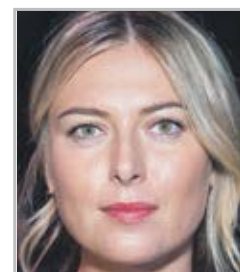
Мария ШАРАПОВА Теннисистка, самая известная за рубежом российская спортсменка