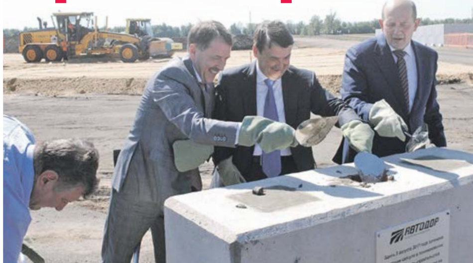
Почетные гости подписали послание для будущих поколений и замуровали капсулу в бетонном основании

Новый участок магистрали пройдет по территории Бобровского, Павловского и Верхнемамонского районов. Дорога будет соответствовать категории 1Б, что означает наличие четырех полос с разделенными встречными потоками и развязками в разных уровнях. Перекрестки и светофоры не предусмотрены. Прогнозируемая скорость автомобилей – 120 километров в час. Интенсивность движения в первые пять лет эксплуатации – 10-12 тысяч машин в сутки.