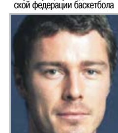
Марат САФИН Теннисист, член Международного зала теннисной славы

Хотя интуиция с невероятной точностью подсказывает Вам правильные решения, не поддавайтесь суевериям. Не исключено, что близкие потребуют расстаться с нейтралитетом в отношении давней проблемы. Возможная длительная командировка принесет больше пользы, если вы отправитесь в нее не самостоятельно, а в компании коллеги-Тельца.