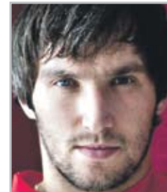
Александр ОВЕЧКИН Хоккеист, нападающий клуба НХЛ, входит в рейтинг самых богатых спортсменов мира

Твердость ваших убеждений пройдет серьезную проверку на прочность, причем главный стресс-тест организует поклонник-Козерог, попытавшись навязать свой взгляд на дальнейшее развитие ваших отношений. На работе звезды советуют, на время, прекратить тренировать коллег и понизить планку. Если чувствуете, что кто-то заслужил комплимент, не скупитесь.