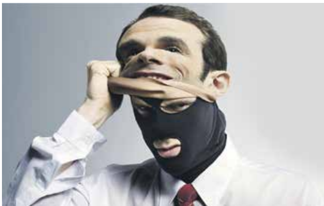
Исполнители изначально понимали, что условий договора не выполнят, однако их не остановил ни почтенный возраст обратившейся, ни тот факт, что ей пришлось вносить требуемую сумму по частям