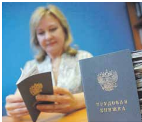
В случае потери трудовой книжки вы можете обратиться к работодателю по последнему месту работы с письменным заявлением об оформлении дубликата или восстанавливать ее самостоятельно

б) сведения о работе и награждении (поощрении), которые вносились в