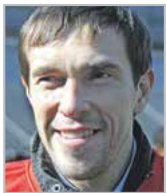
Павел ДАЦУК в 2017 был включен в список 100 величайших хоккеистов за всю историю НХЛ