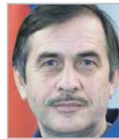
Павел ВИНОГРАДОВ российский космонавт, совершил 7 выходов в открытый космос