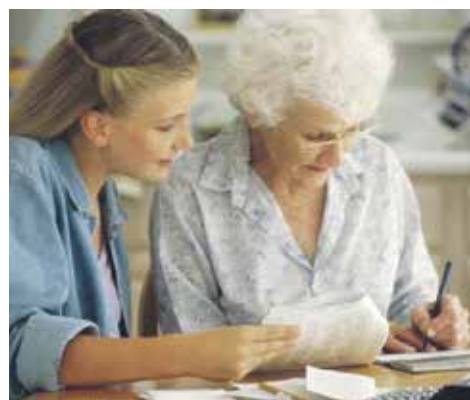
Согласно Гражданскому кодексу РФ, договор ренты, а также договор, предусматривающий отчуждение недвижимого имущества под выплату ренты, подлежат государственной регистрации

Кроме этого, было проведено 3 выездных приема граждан в рамках работы Региональной общественной приемной Председателя Партии «Единая Россия». Присутствовало 20 человек, решаемость обращений с приемов составила порядка 90 %.