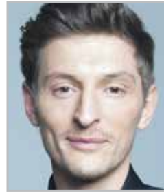
Павел ВОЛЯ бессменный резидент и ведущий Comedy Club