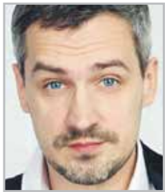
Павел САВИНКОВ нашел путь к сердцу зрителей благодаря комедии «Счастливы вместе»