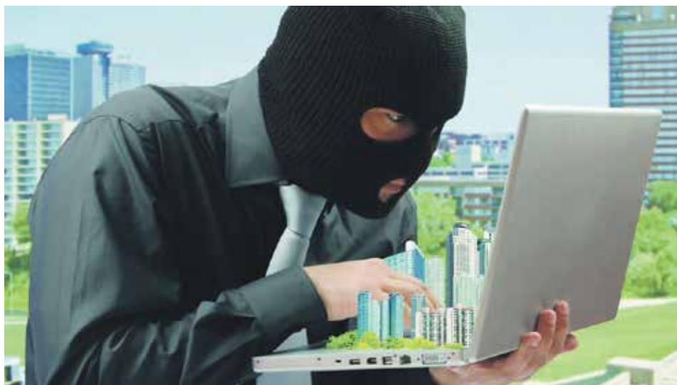
В мае 2019 года в России зафиксирован первый известный случай отъема квартиры путем манипуляций с документами в результате использования электронной подписи

Отметим, что выдать усиленную квалифицированную электронную