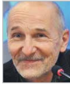
Петр МАМОНОВ рок-музыкант, актер, поэт, известен по группе «Звуки Му»