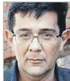
Петр КУЛЕШОВ ведущий интеллектуальной телевикторины «Своя игра»