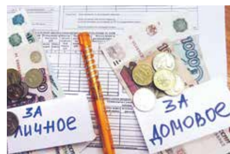
Нормативы потребления коммунальных ресурсов на содержание общего имущества в многоквартирном доме устанавливаются едиными для многоквартирных и жилых домов, имеющих аналогичные конструктивные и технические параметры

Согласно пункту 2 статьи 39 Жилищного кодекса, доля обязательных расходов на содержание общего имущества в многоквартирном доме, бремя которых несет владелец квартиры, определяется его долей в праве собственности на общее имущество в таком доме.