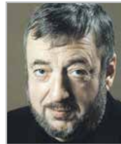
Павел ЛУНГИН один из самых ярких и известных отечественных кинорежиссеров