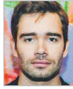
Петр ФЕДОРОВ звезда кинопроектов «Обитаемый остров», «Сталинград»

Астропрогноз рекомендует завершить рабочие проекты, скользящие ваши дальнейшие движения. Вероятно, что к началу осени вам будет предложено повышение или новая работа. Если вы планируете путешествие, то делайте ставку на Европу. Многих Водолеев ждут события, которые преобразят их жизнь – свадьба, рождение детей.