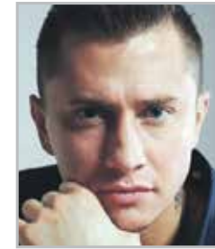
Павел ПРИЛУЧНЫЙ актер театра и кино, телеведущий, продюсер