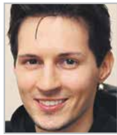
Павел ДУРОВ один из создателей социальной сети «ВКонтакте»