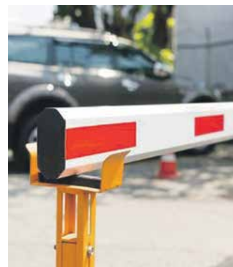
Если решение об установке ограждения на придомовой территории было принято на общем собрании собственников, в котором вы не принимали участие, вы вправе обратиться в суд с иском о признании решения недействительным

Таким образом, в течение шести месяцев с момента проведения общего собрания собственников, вам необходимо обратиться в суд с иском о признании решения данного собрания недействительным.