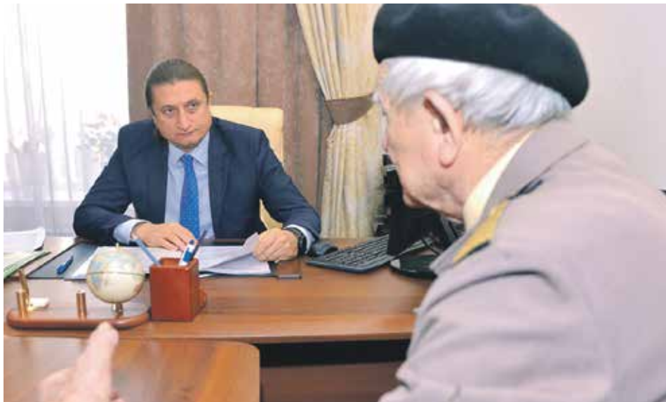
Обращения от обманутых граждан за помощью в общественные приемные депутата Госдумы Сергея Чижова нередки. Консультации высококвалифицированных юристов нацелены на повышение правовой грамотности

социальной защиты Воронежской области с просьбой о присвоении ей звания «Ветеран труда».