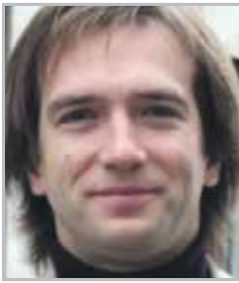
Петр КРАСИЛОВ актер, запомнился по сериалам «Не родись красивой», «Бедная Настя»