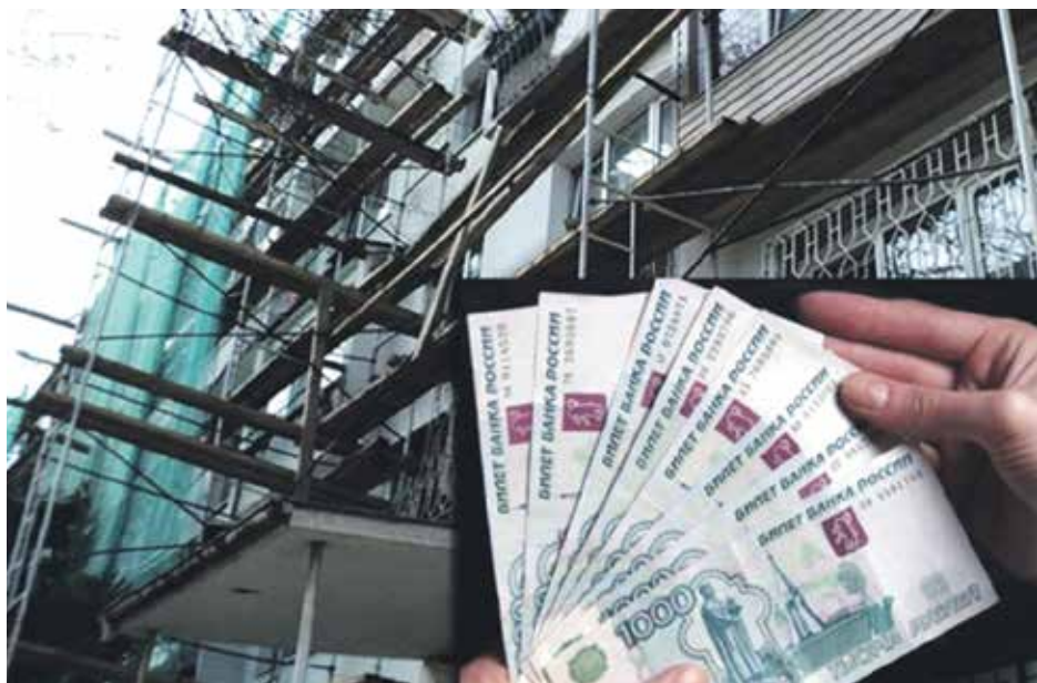
Решение общего собрания собственников помещений в многоквартирном доме о формировании фонда капитального ремонта на специальном счете должно содержать также решение о выборе уполномоченного для представления платежных документов

Владельцем специального счета может быть: