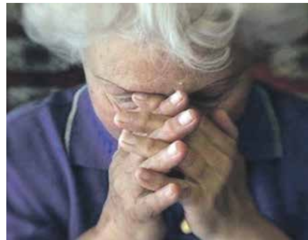
К сожалению, изучать свои права и обязанности многие начинают не по собственной воле, для, так сказать, общего образования, а в силу весьма драматичных, иногда даже трагических обстоятельств